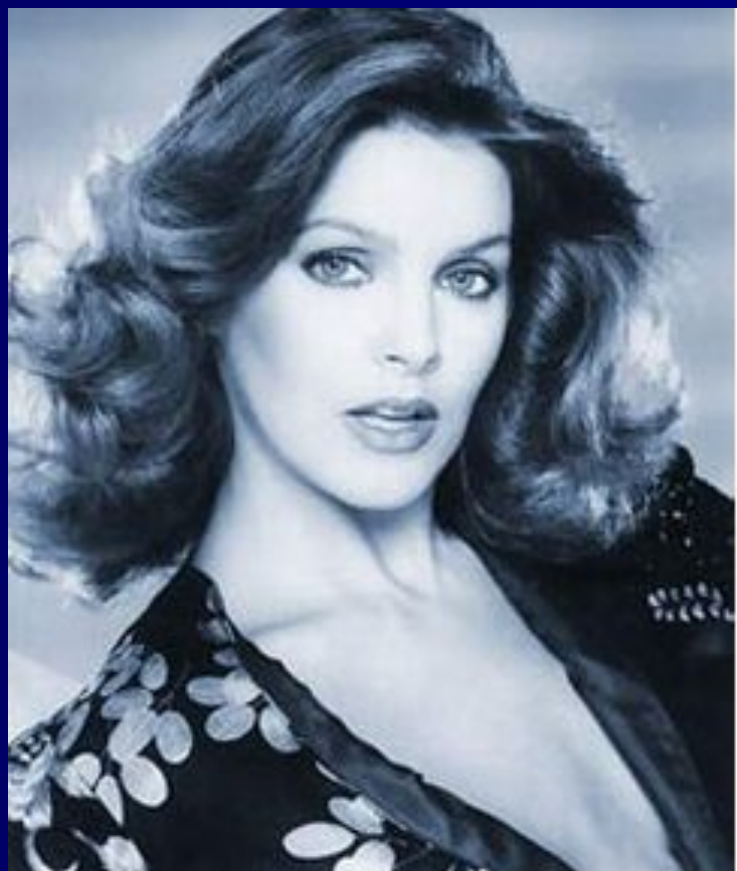
ФОТО ЙОГО ЖІНКИ