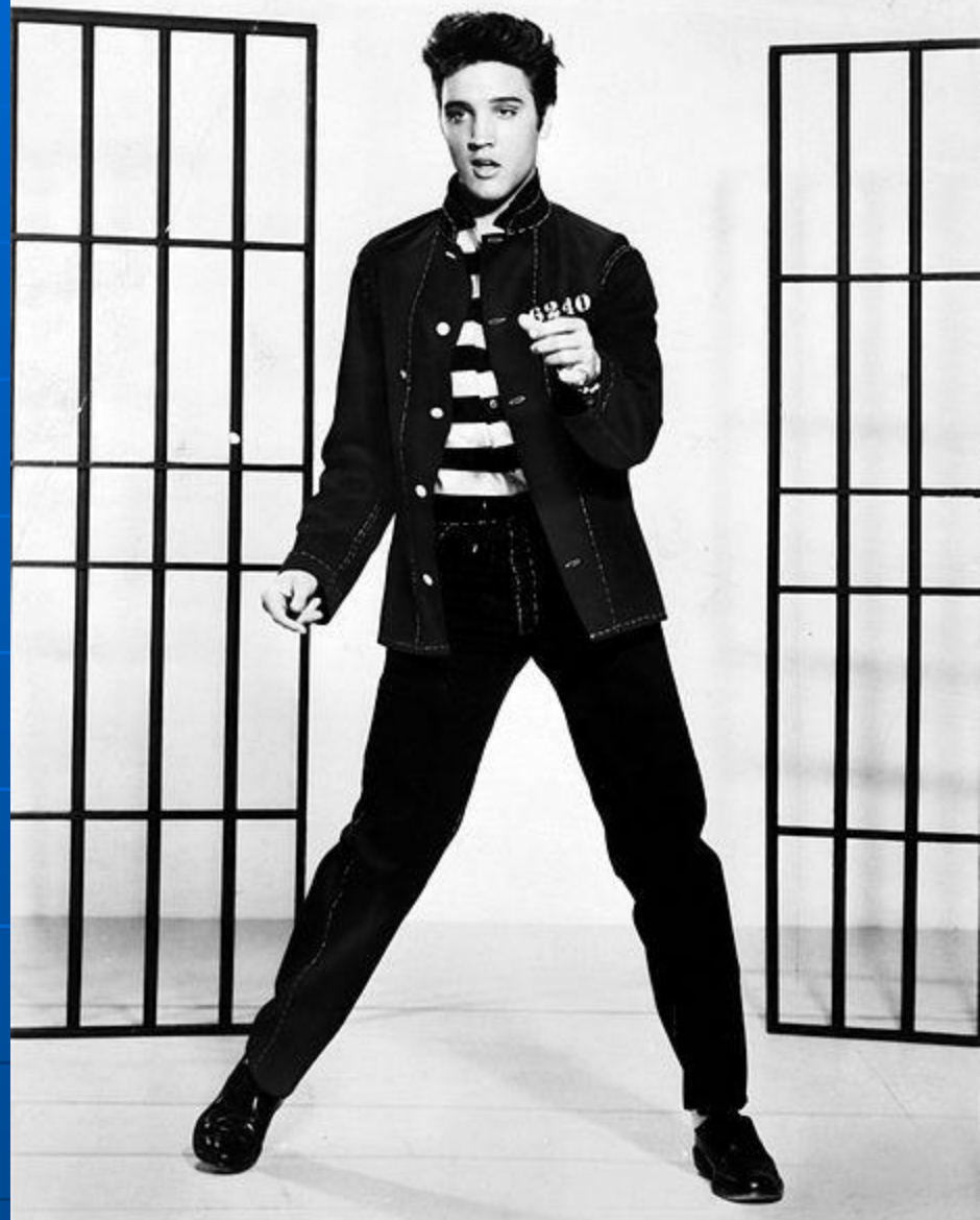
Кадр із фільму «Тюремний рок». Преслі виконує однойменну пісню фільми