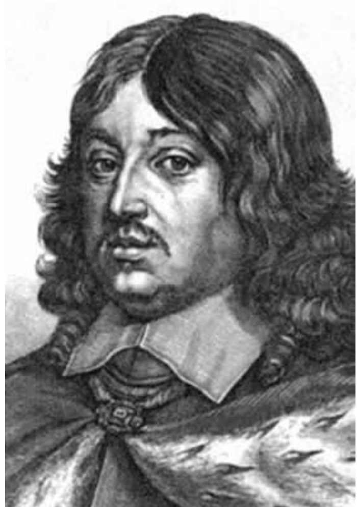
Карл X Густав

Будучи прихильником семигородського князя Ракочія, у 1655 році перейшов на бік шведського короля Карла X Густава.