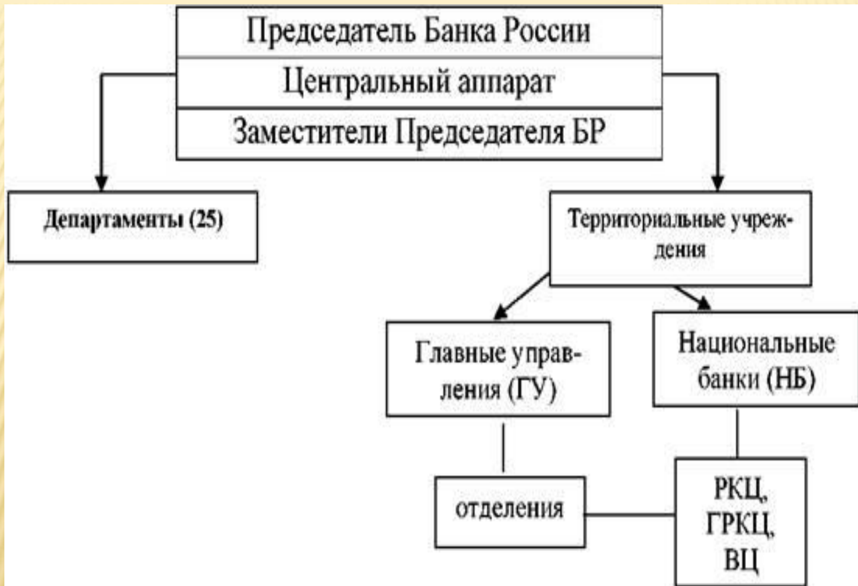
Рис. 5. Организационная структура Банка России