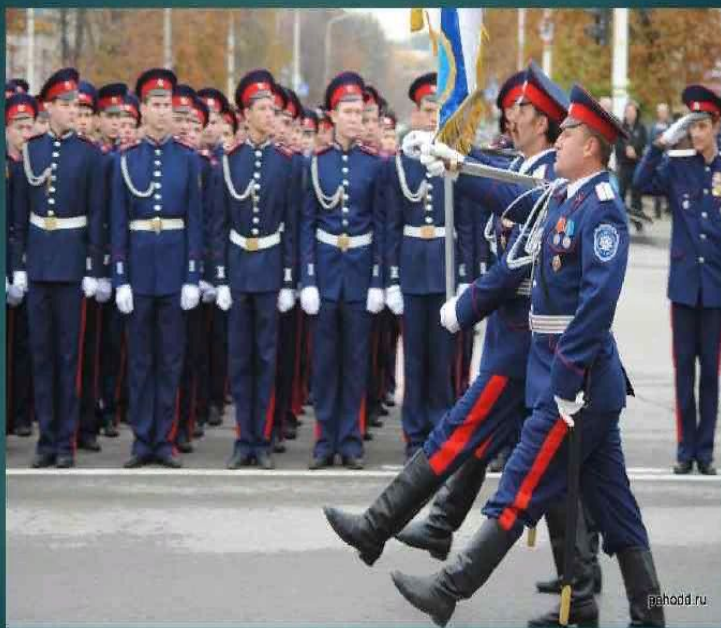
Современная форма Донских казаков

Народные дружинники из числа членов казачьих обществ выполняют обязанности по охране общественного порядка в форменной одежде, установленной для членов соответствующего казачьего общества, с использованием символики народного дружинник