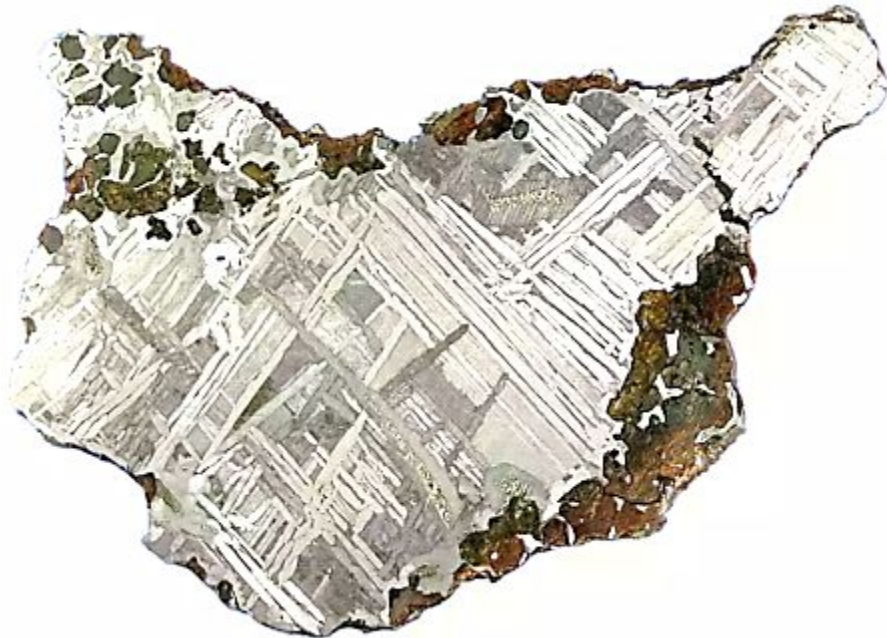
Узорчатое строение железного метеорита

Эти и другие данные свидетельствуют о том, что метеориты являются обломками астероидов.