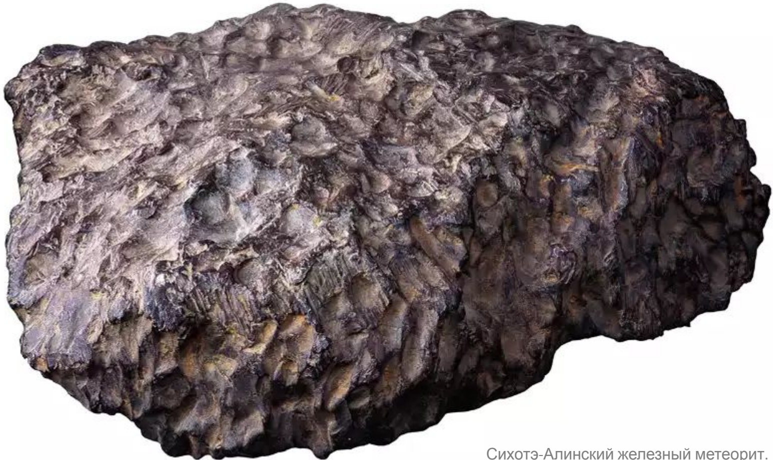
Сихотэ-Алинский железный метеорит. Фрагмент.

Самый большой из кратеров имел диаметр около 26 м и глубину 6 м.