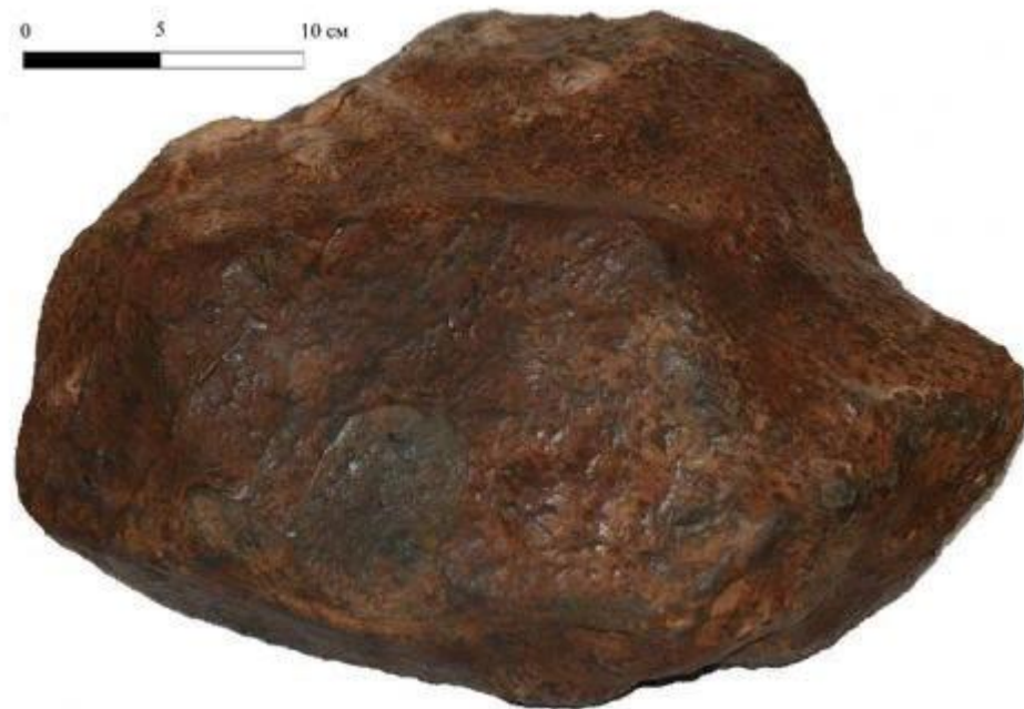
Каменный метеорит весом 33,2 кг.