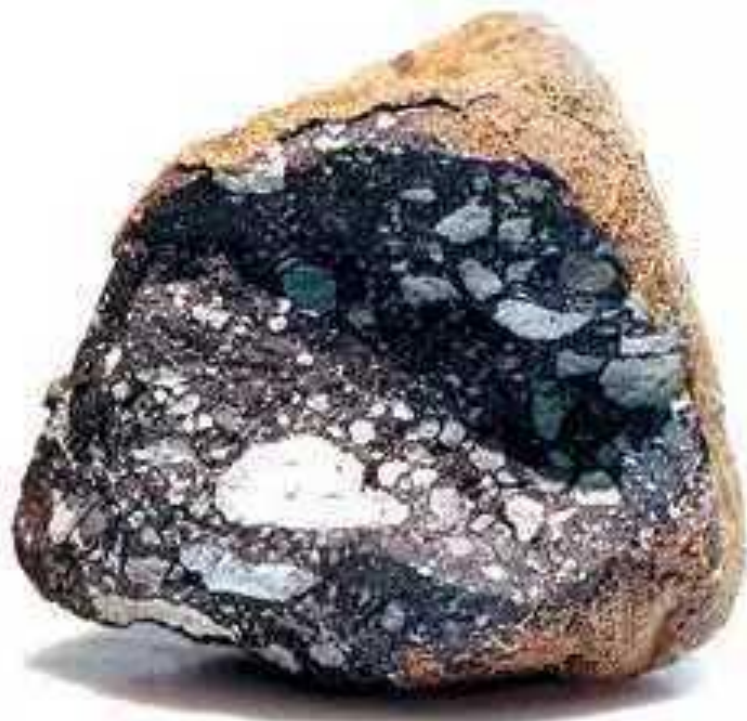
Каменный метеорит ALH 81005, прилетевший с Луны. Найден у холмов Аллан-Хиллс в Антарктиде. Размер — около 3 см.

Каменные метеориты составляют более 90% всех падающих на Землю метеоритов.