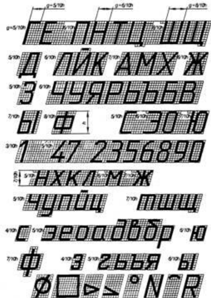
ШРИФТ ЧЕРТЕЖНЫЙ ТИПА Б ( d=1/10h ) С НАКЛОНОМ ОКОЛО 75^\circ (ГОСТ 2.304-81)