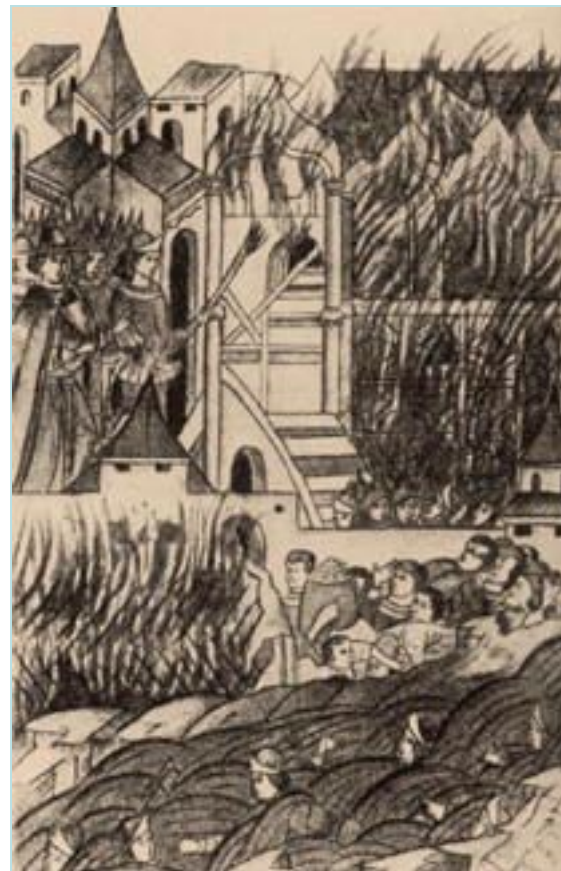
Восстание в Твери

В 1327 году в Твери вспыхнуло восстание против ордынских баскаков, во главе которых был жестокий Чолхан. Иван Данилович тут же поспешил за помощью к хану Узбеку. Вернувшись с татарским войском, «огнем и мечом» прошел по Тверской земле. Князь Твери Александр бежал в Псков. Верность Калиты была вознаграждена - он получил Новгород и Кострому, а в 1332 году ярлык на владимирское княжение.