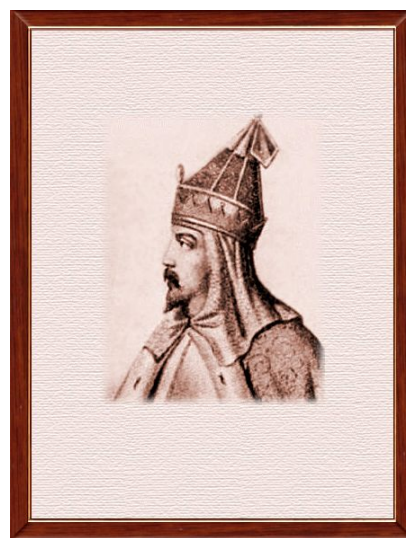
Иван II Красный