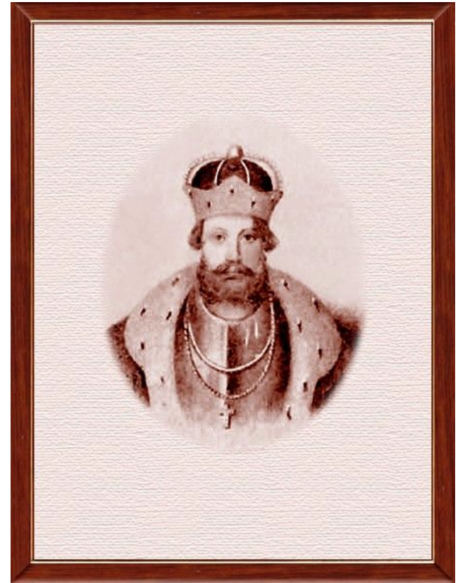
Великий князь Михаил Ярославич Тверской

Говоря о причинах возвышения Москвы , обычно называют естественную защиту ее границ, удобное расположение на торговых путях, плодородные земли и т.д. Однако, посмотрев на карту, можно увидеть, что не одна Москва обладала столь важными преимуществами. Не менее выгодным было расположение Тверского княжества , которое в середине XIII века оказалось в руках младшего брата Александра Невского - Ярослава Ярославича . После смерти Ярослава с 1285 года князем Тверским стал Михаил Ярославич . Именно эта княжеская линия соперничала с линией московских князей, потомков победителя на Чудском озере.