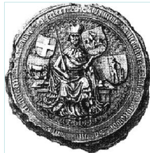
Печать Витовта, великого князя Литовского. 1407 год

Другим центром объединения стала Северо-Восточная Русь . Это естественно вело к острому соперничеству местных княжеств за лидерство. Нетрудно предположить, что будущий победитель был обречен на столкновение с Литвой.