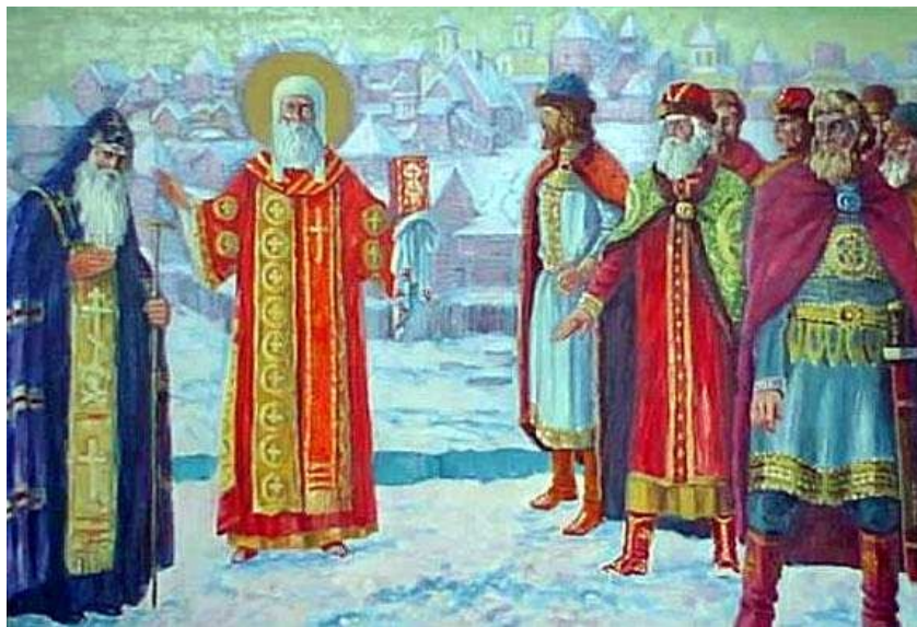
Иван Калита и Святой Петр

Став правителем «надо всею Русской землею», Иван Калита расширял свои владения. Он получил право сбора дани со всех русских земель (часть выхода оседала в подвалах Московского Кремля). Репутация верного стража интересов хана на несколько десятков лет избавила страну от крупных татарских набегов. Бесспорная заслуга Ивана Калиты и его преемников была в том, что в эти годы шло не только хозяйственное возрождение, но и выросло целое поколение, не испытывавшее страха перед ордынцами - поколение Куликова поля.