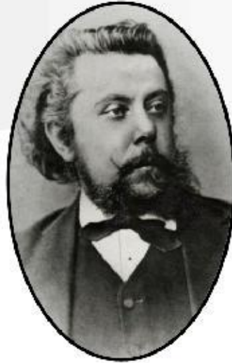
Модест Петрович Мусоргский