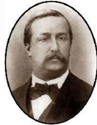
Александр Порфирьевич Бородин