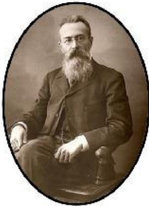
Николай Андреевич Римский-Корсаков