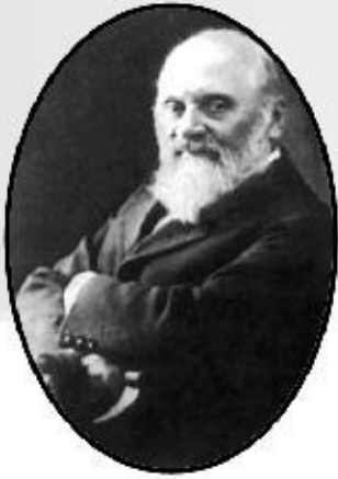
Милий Алексеевич Балакирев