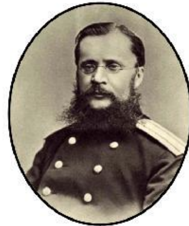
Цезарь Антонович Кюи

2.) Могучая кучка распалась к 1874 году. Более того Римский Корсаков перестал общаться с Мусорским, с Кюи и Балакиревым.