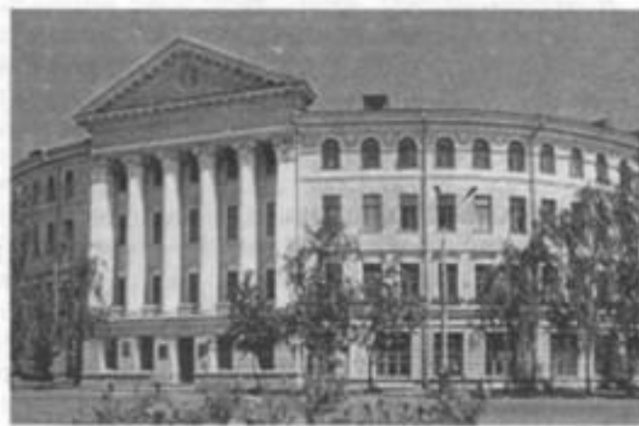
Національний університет «Києво-Могилянська академія».