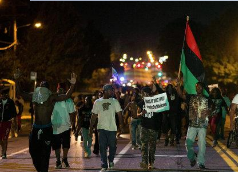
Ливийцы на улицах Америки

Расовый конфликт – конфликт между представителями разных рас, возникающий в результате их социального неравенства и расовых предрассудков.