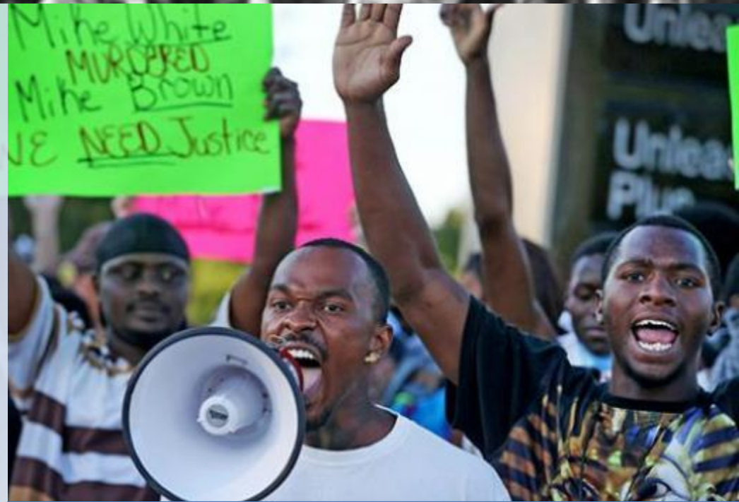
Чернокожие митингующие на улицах Фергюсона

Гибель Брауна вскрыла многолетнюю проблему региона: чернокожие жители, составляющие 65% населения Фергюсона, жаловались, что полиция их притесняет. Как оказалось, в полицейском отделении городка работают лишь три темнокожих офицера, остальные 50 человек — представители белой расы.