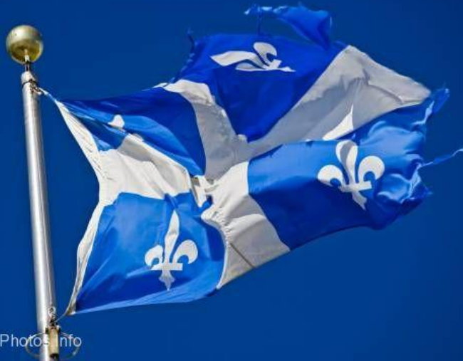
Флаг провинции Квебек

Истоки требования суверенизации французской части Канады лежат в этнических корнях, общем культурном коде, языке, непрерываемых связях Квебека с Францией. Квебек — самая большая провинция Канады, где живут 6 млн. из более чем 7 млн. франко-канадцев. Перемены начались в 1960 году, когда на выборах к власти в Квебеке пришли молодые либералы. Новое правительство начало реформы, получившие название "тихая революция" — и за 20 лет успешно их осуществило. На референдуме 30 октября 1995 г. жители канадской провинции Квебек голосовали по вопросу о независимости. Вопрос был поставлен так: "Согласны ли вы, чтобы Квебек стал независимым, после того как предложит Канаде новое экономическое и политическое партнерство".