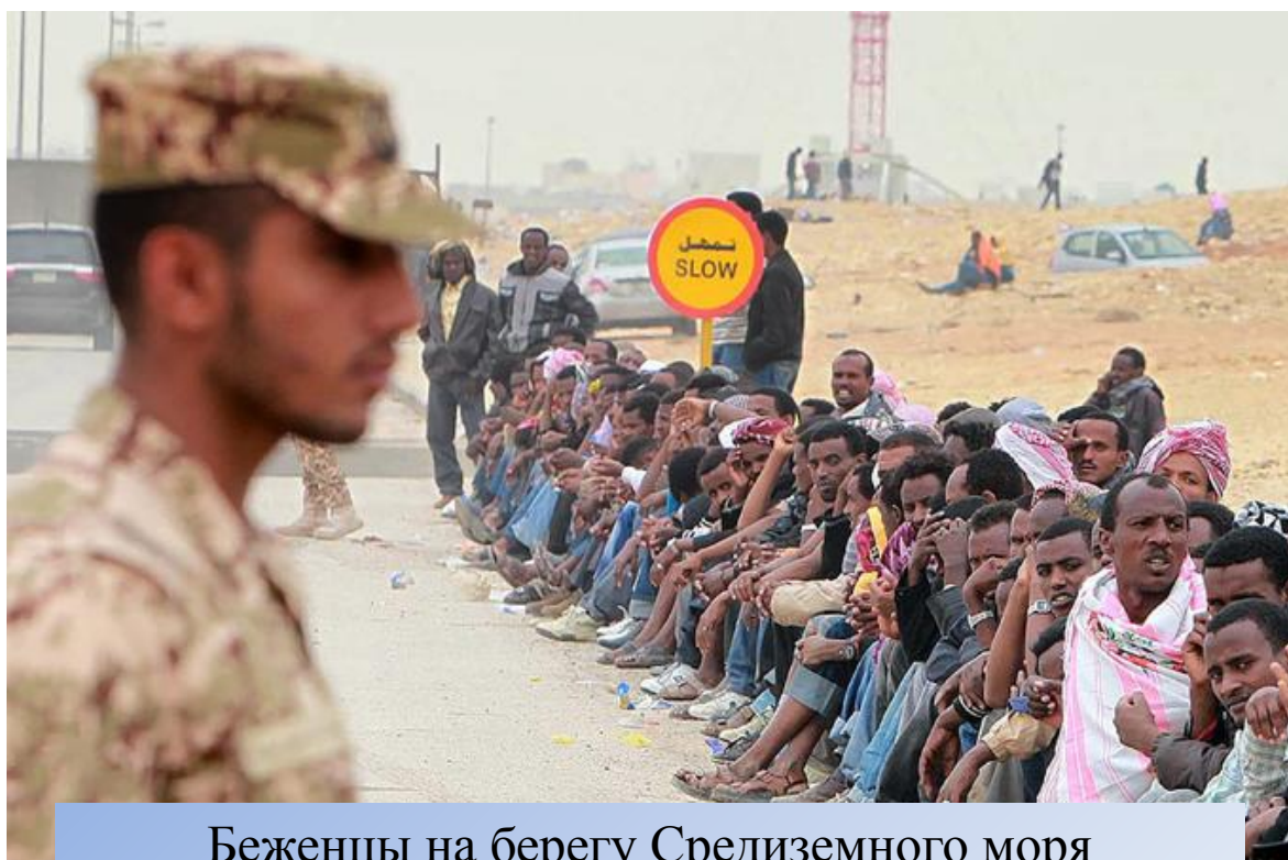
Беженцы на берегу Средиземного моря

-Масштабные миграции населения после Второй Мировой войны.