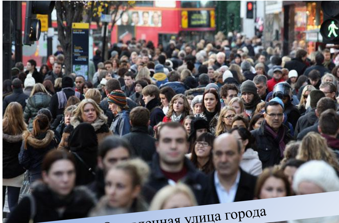
Оживленная улица города

Проблема межэтнических и конфессиональных конфликтов является наиболее острой в последние несколько десятилетий, это наиболее распространенный источник политической нестабильности.