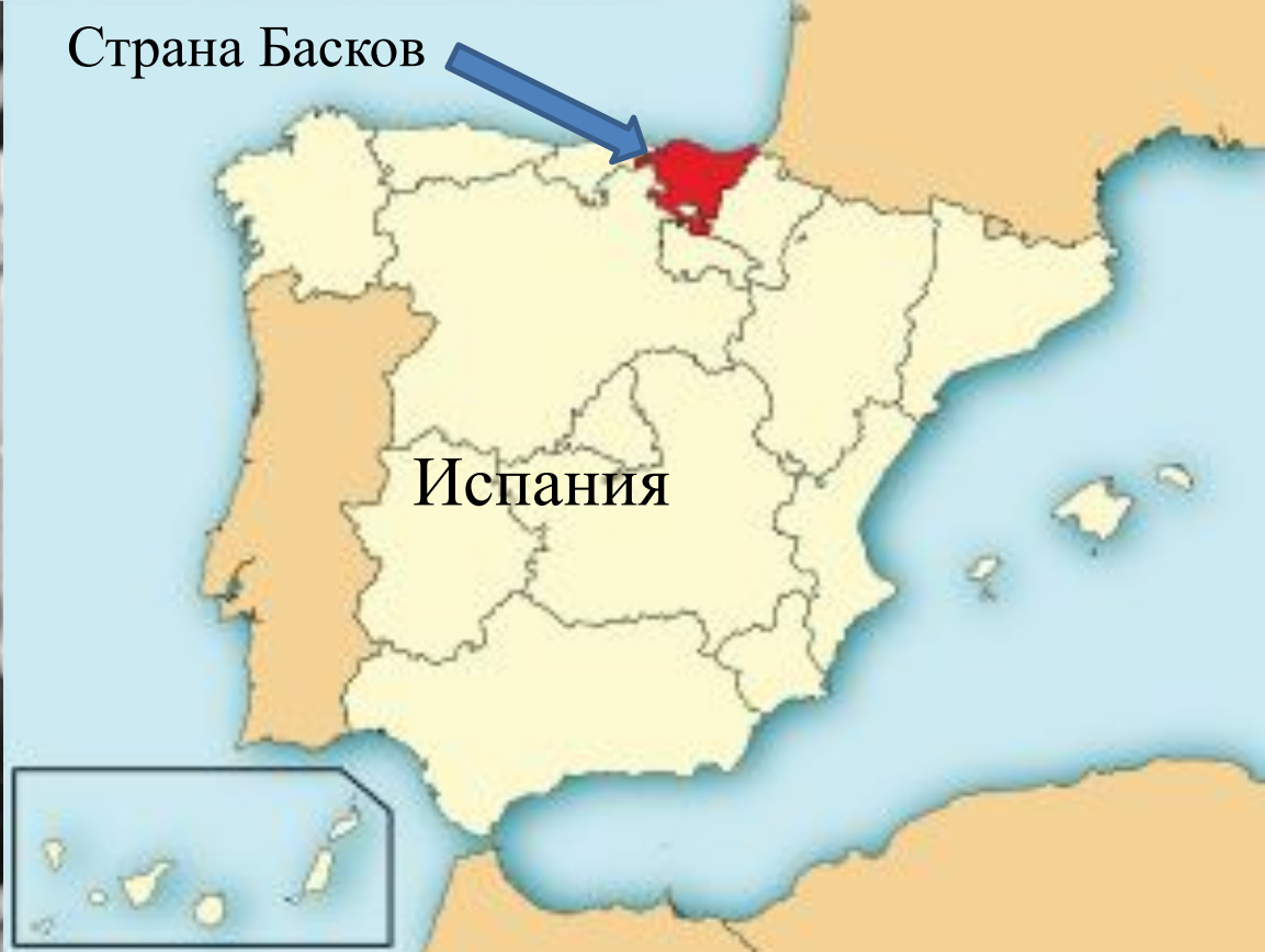
Страна Басков на карте Испании

Основная цель сепаратистов - создание независимой "Великой Эускади - Страны басков", которая должна включить ряд провинций северной Испании, южной Франции, а также испанскую область Наварра. В этом конфликте заметную роль играет социалистическая радикальная организация Euskadi Ta Askatasuna ("Эускади та аскатасуна" - "Отечество и свобода басков"), известная под аббревиатурой ЭТА.