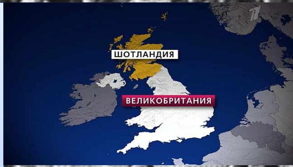
Шотландия на карте Великобритании

Шотландия была независимым государством с 843 по 1707 г. Есть мнение, что Шотландия стала частью Соединенного Королевства, потому что отчаянно нуждалась в деньгах