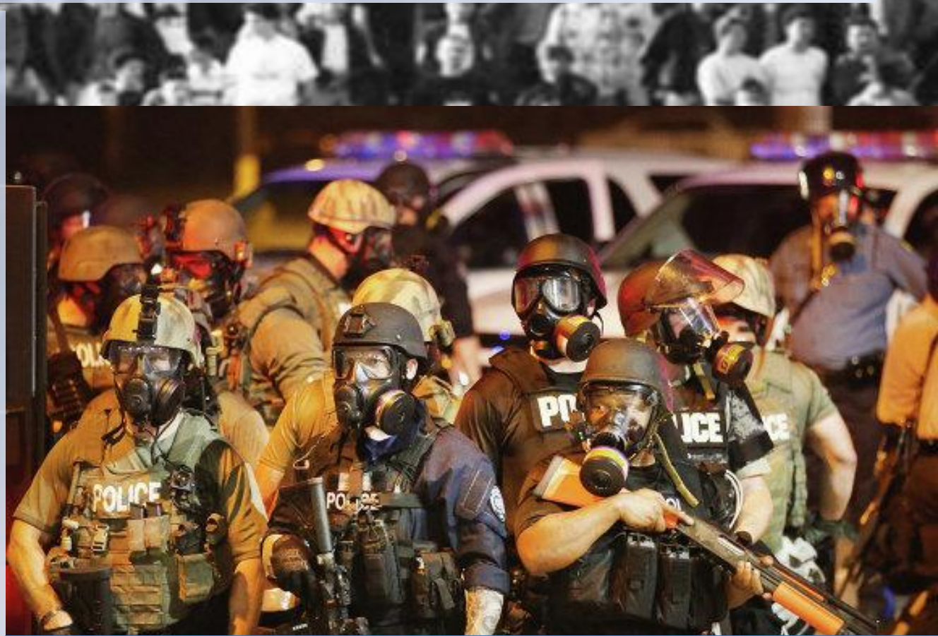
Полиция прибыла на разгон демонстрантов

На следующий год, в 1968-м, очередные акции вооруженного протеста вспыхнули после убийства Мартина Лютера Кинга. Всего же в 150 столкновениях на расовой почве, что сотрясали Штаты в 60-х, погибли около 300 человек. При этом за всю первую половину XX века в Соединенных Штатах было зафиксировано впятеро меньше «черных бунтов», чем в период с 1964 по 1969 год.