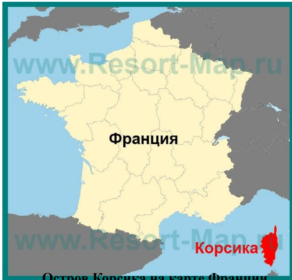
Остров Корсика на карте Франции