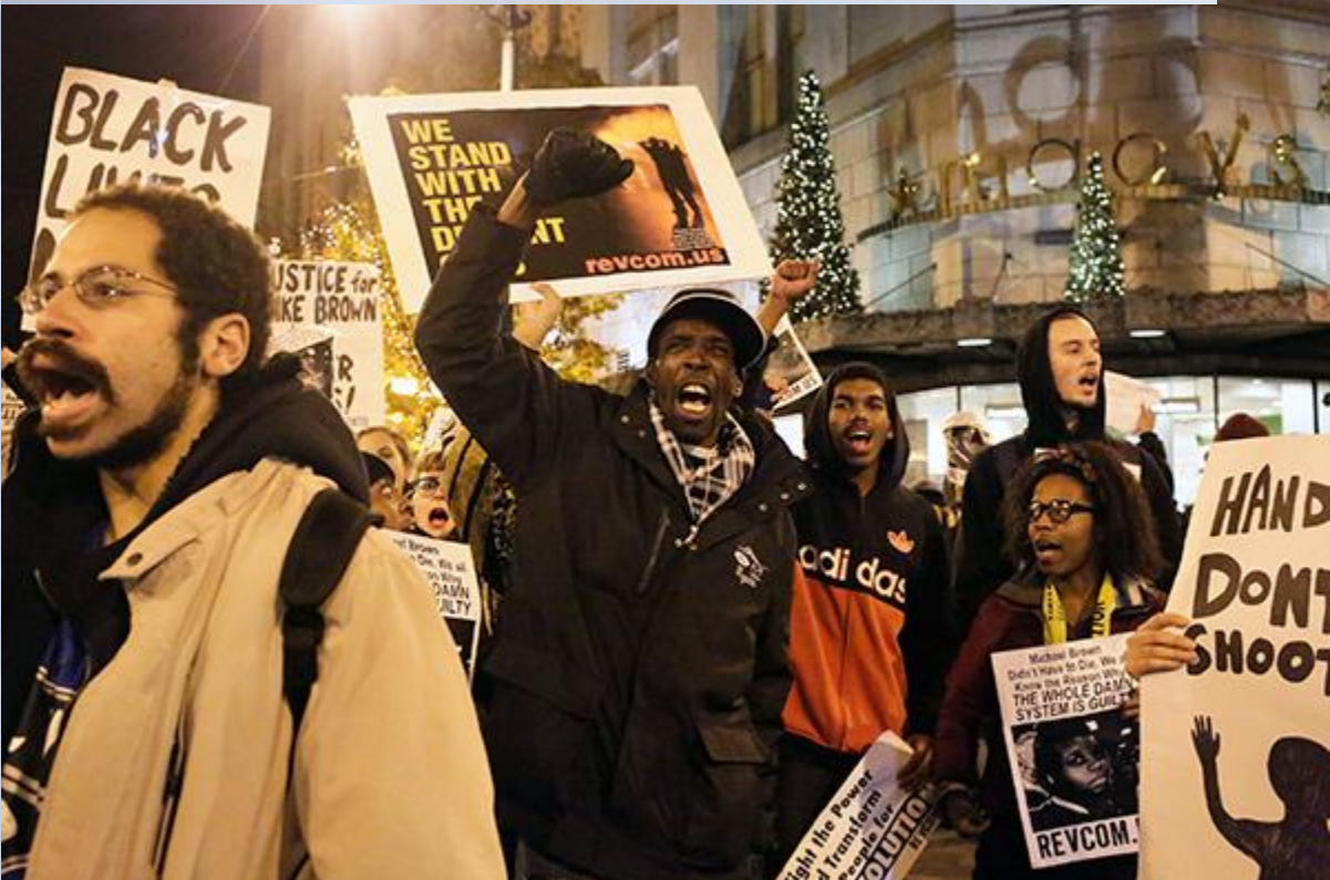
Бастующие на улицах США

Поводом для первых массовых столкновений в июле 1964 года стало убийство нью-йоркским полицейским Джелигеном 15-летнего чернокожего. В ту же ночь в результате вспыхнувших беспорядков было ранено 140 и арестовано 520 человек, а спустя год еще одно убийство полицейским жителя Гарлема также повлекло волнения.