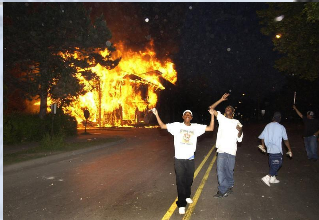
Афроамериканская молодежь на фоне горящего здания