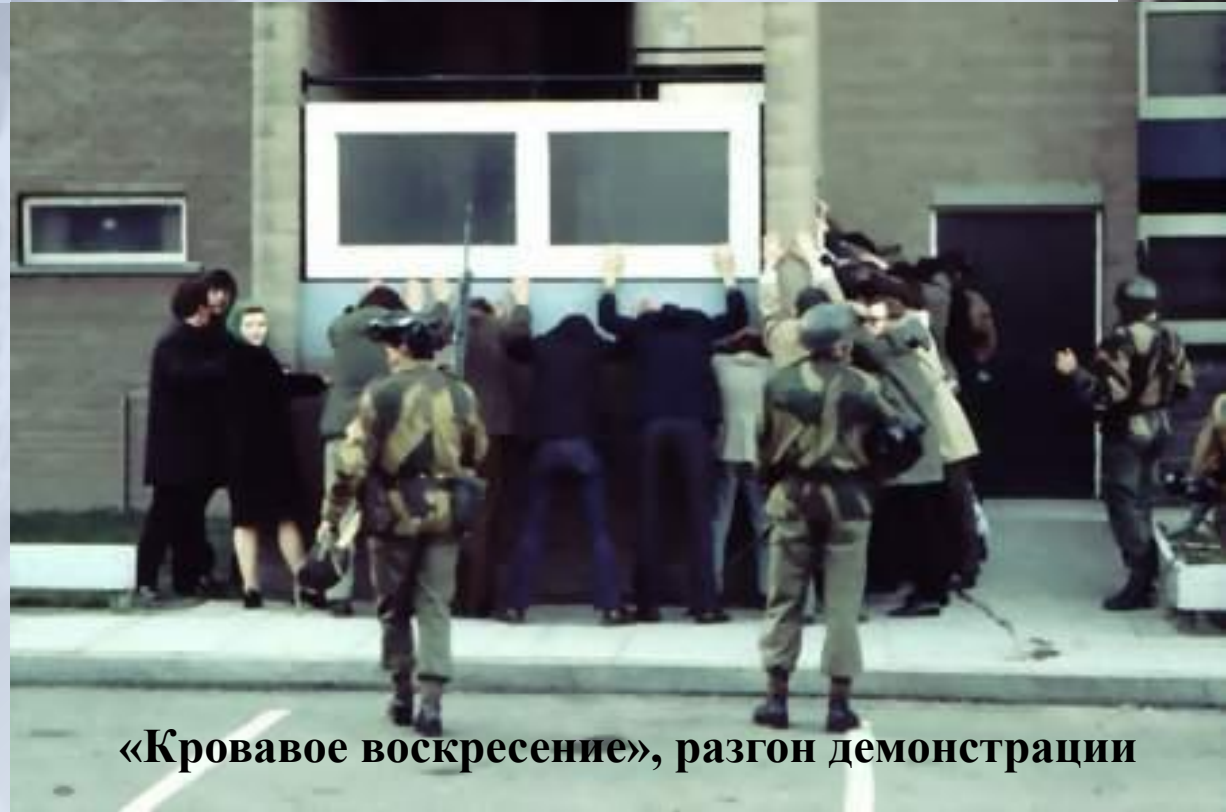
«Кровавое воскресенье», разгон демонстрации

14 августа 1969 года для урегулирования конфликта Лондон отправил в регион войска. Всплеск насилия начался после «Кровавого воскресенья» («Bloody Sunday») — 30 января 1972, когда британские солдаты расстреляли безоружную демонстрацию борцов за гражданские права в Дерри (Северная Ирландия), в результате чего погибло 18 человек. 30 мая 1972 ИРА объявила о прекращении активных боевых действий. Однако, поскольку британское правительство отказывалось вести переговоры с сепаратистами, то боевики ИРА возобновили теракты на территории Ольстера и Англии.