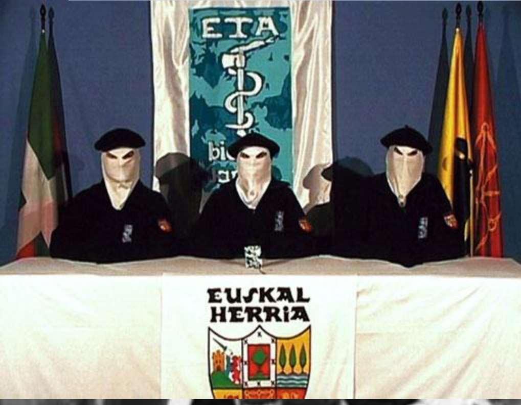
Три члена ЭТА на пресс-конференции в 2006г.

Террористическая организация баскских сепаратистов, пришла на смену разгромленному в 1950-х гг. партизанскому движению; ЭТА выделилась из Баскской националистической партии. В 1959 несколько молодых членов БНП, неудовлетворенных отказом организации от вооруженной борьбы, покинули партию и основали ЭТА. Сепаратистские настроения Басконии являлись выражением национального, социального и религиозного противостояния Мадриду. С начала 1960-х годов члены ЭТА приступают к практике покушений на чиновников и жандармов, а также начинают осуществлять взрывы полицейских участков, казарм и железнодорожных путей.