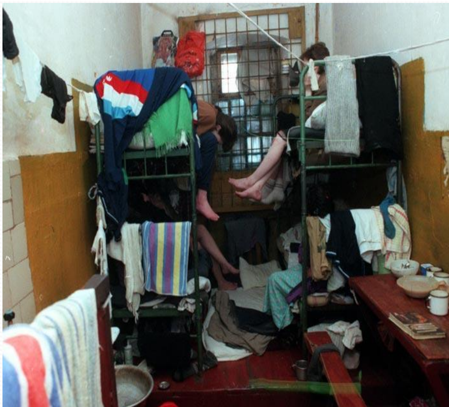
Приложение № 1 Форма № 1П