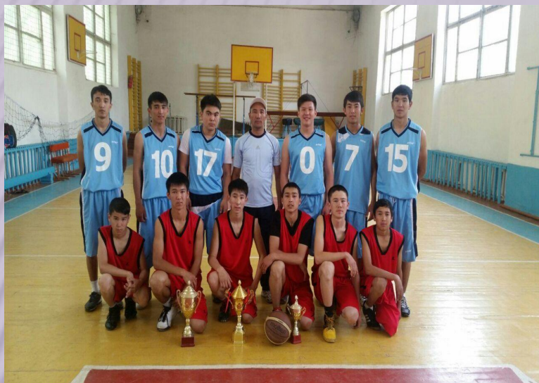
Аудандық баскетбол жарысынан 1-орын