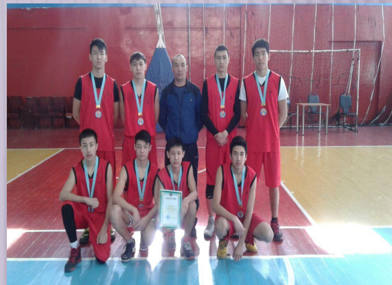
Облыстық баскетбол жарысынан 2-орын