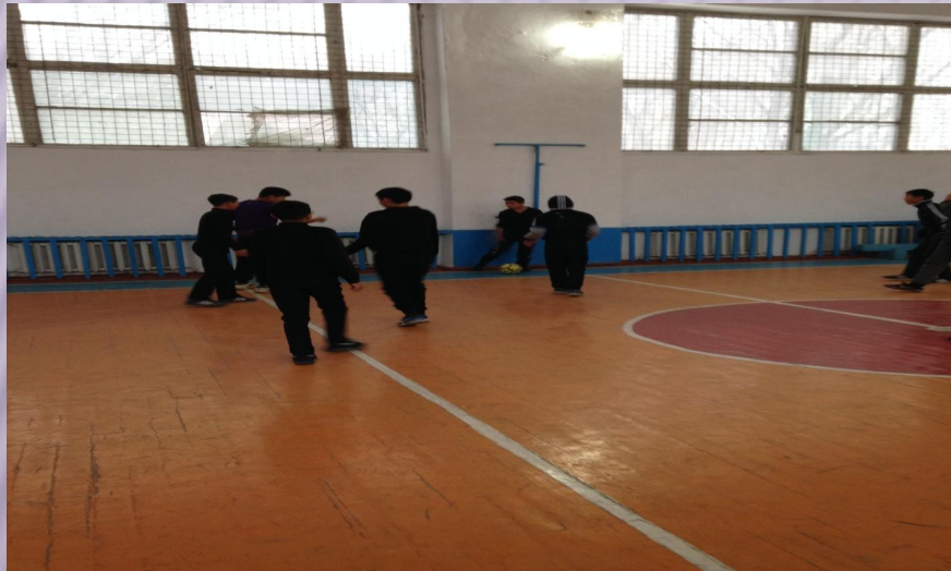
Мектеп лигасының Футзал ойыны үстінде