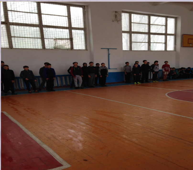
Мектеп лигасының ашылу салтанаты