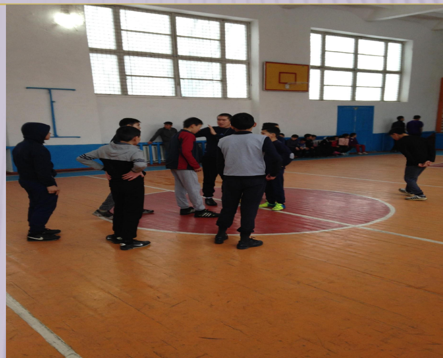
Бас төреші ойын тәртібін түсіндіруде