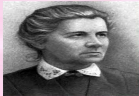
Олена Пчілка дитяча письменниця

Олена Пчілка (Ольга Петрівна Косач; 29 червня 1849 р. – 4 жовтня 1930 р.) належить до числа тих діячів, які невтомною працею на терені української культури зробили значний внесок до духовної скарбниці свого народу. На ниві красного письменства вона трудилась близько шістдесяти літ, випробувавши перо в усіх літературних жанрах: драми та комедії, повісті та оповідання, байки та ліричної поезії, епічної поеми й поетичних перекладів. Людина з широким світоглядом і ґрунтовою освітою, Олена Пчілка зажила слави і в історії української журналістики, зокрема як мистецтвознавець, критик та популяризатор українського мистецтва. Її діяльність як фольклориста і етнографа є ще одним проявом її самобутнього таланту і заслуговує пильної уваги дослідників.