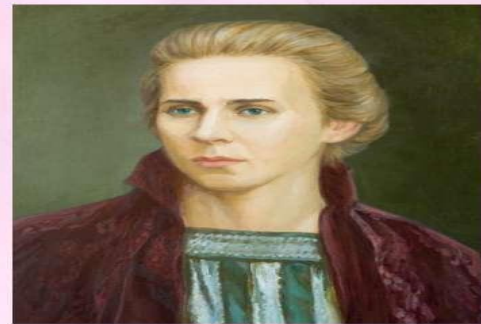
Леся Українка українська письменниця, перекладач, культурний діяч.