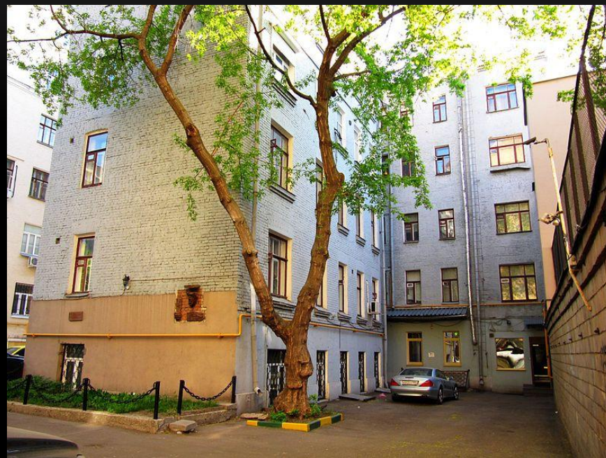
Москва, Большой Каретный переулок, 15. Задняя часть дома, в котором Владимир Высоцкий жил в 1949—1955 г. Видны табличка и барельеф.

В октябре 1949 года он вернулся в Москву и пошёл в 5-й класс мужской средней школы. В это время семья Высоцких жила в Большом Каретном переулке. Этот переулок увековечен в его песне «Большой Каретный».