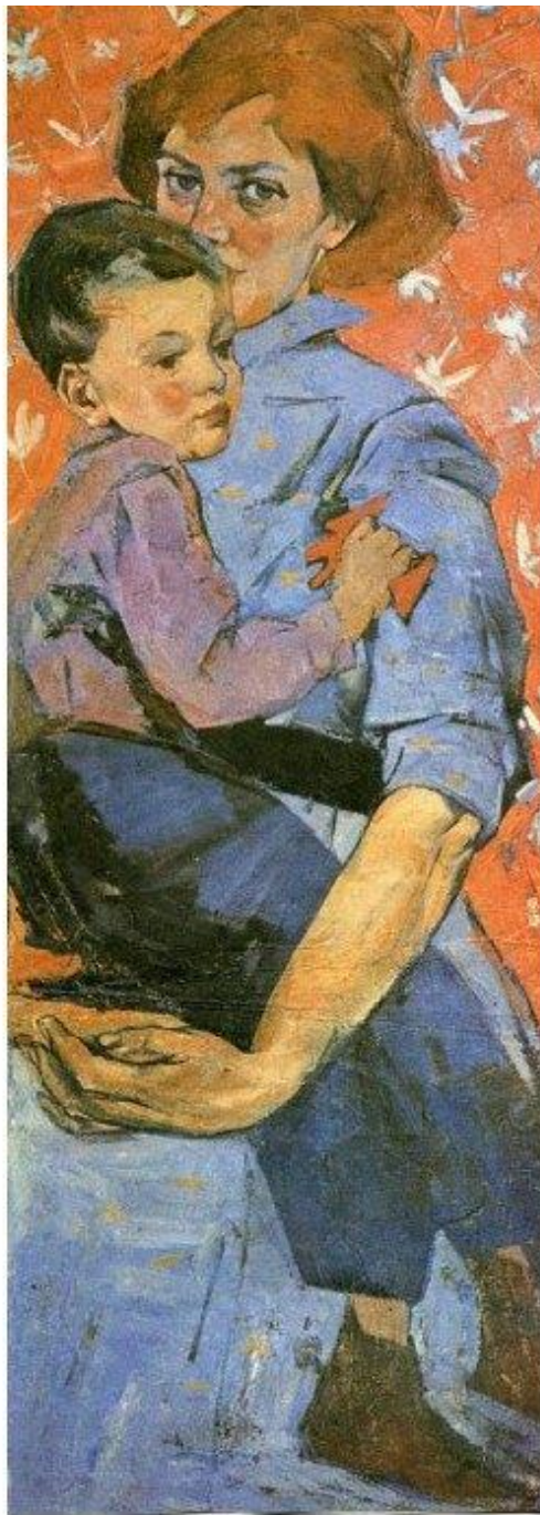
Автопортрет з сином. 1960