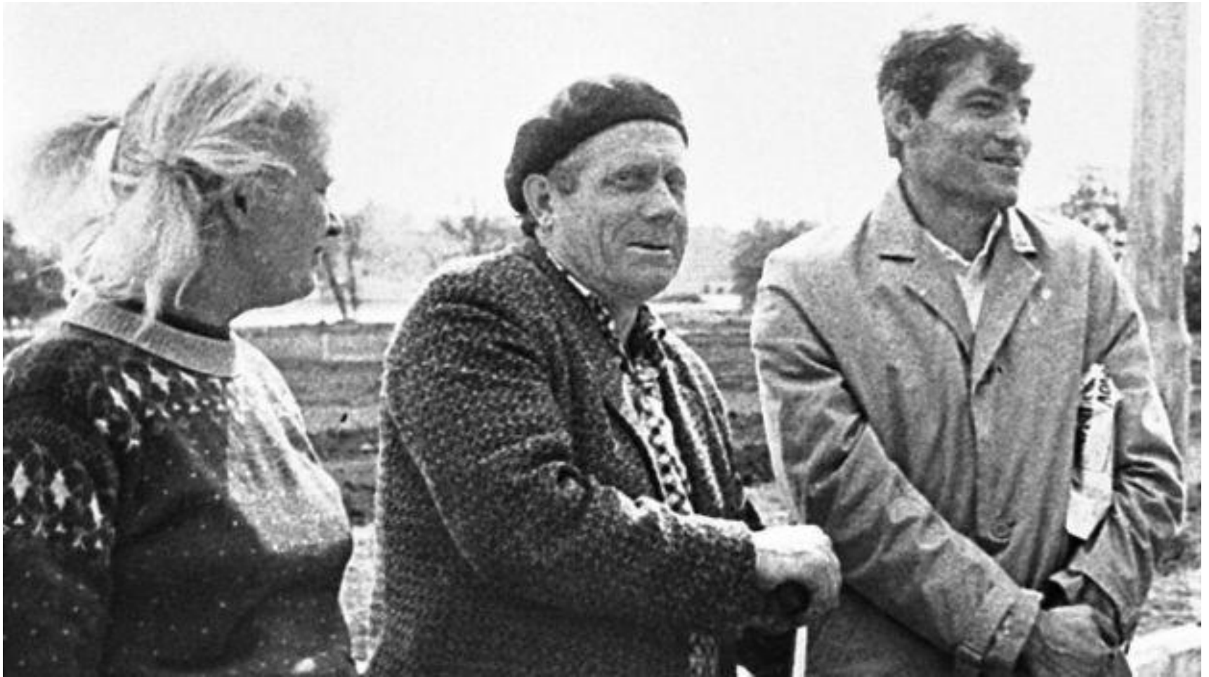
Алла Горська (ліворуч) з Василем Стусом (праворуч)