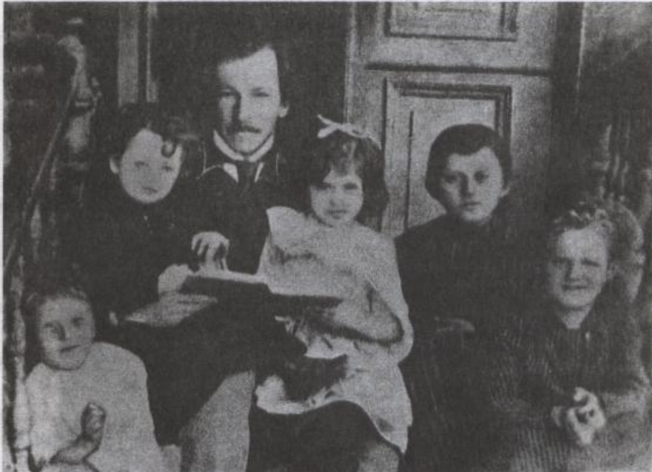
Олександр Олесь серед дітей. Фото 1910-х років.

Народився Олександр Олесь в містечку Білопілля Харківської губернії 5 грудня 1878 року.