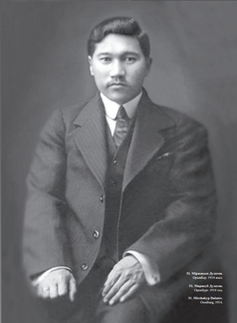
51. Міржақып Дулатов. Орынбор, 1914 жыл.

Міржақып Дулатұлы (1885—1935) — қазақтың аса көрнекті ағартушысы, қоғам қайраткері, ақын , жазушы , жалынды көсемсөз шебері.