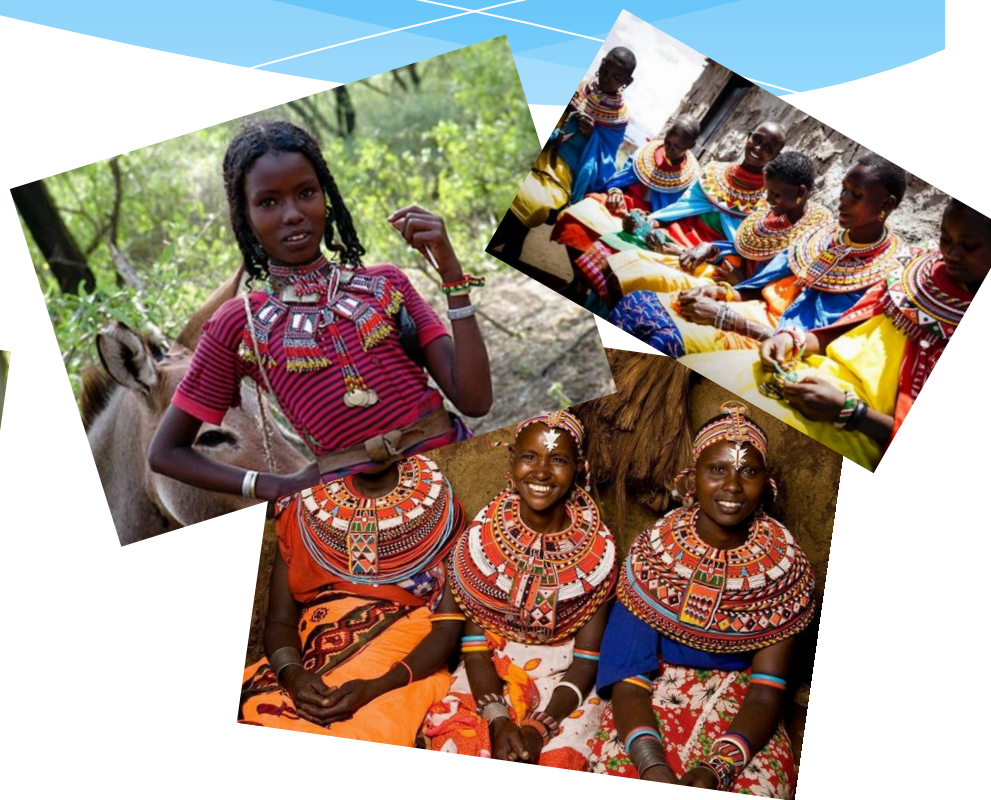
люди у Африці