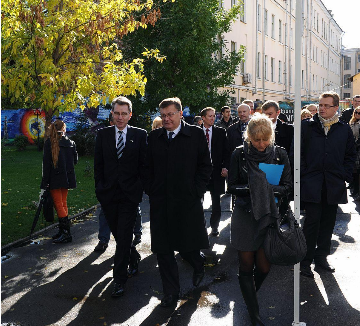
Церемонія відкриття BIONIC University. Віце-прем'єр-міністр України Костянтин Грищенко та посол США в Україні Джеффри Р. Пайєтт, 27 вересня 2013