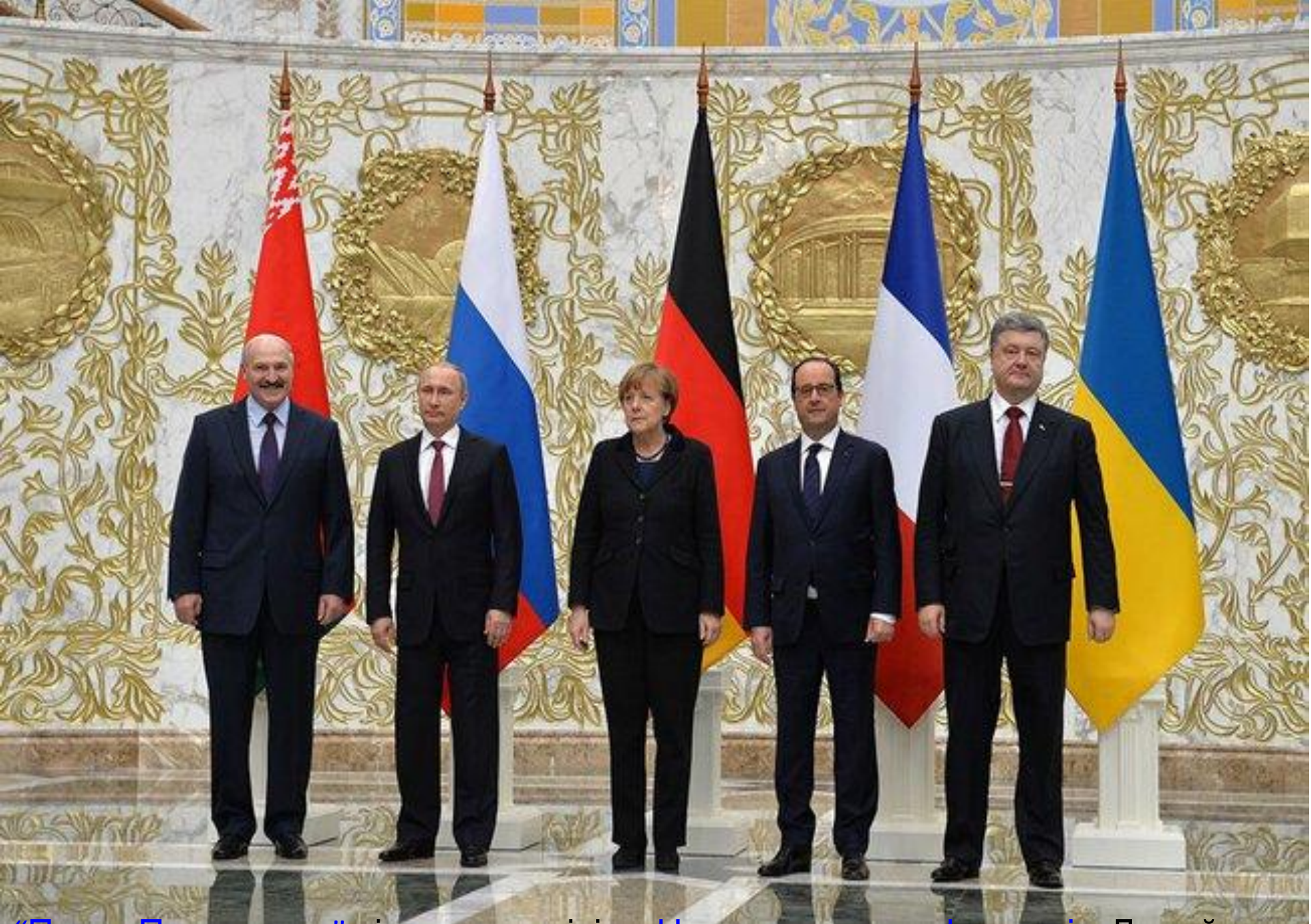
“Петро Порошенко” під час зустрічі в «Нормандському форматі» . Лютий 2015