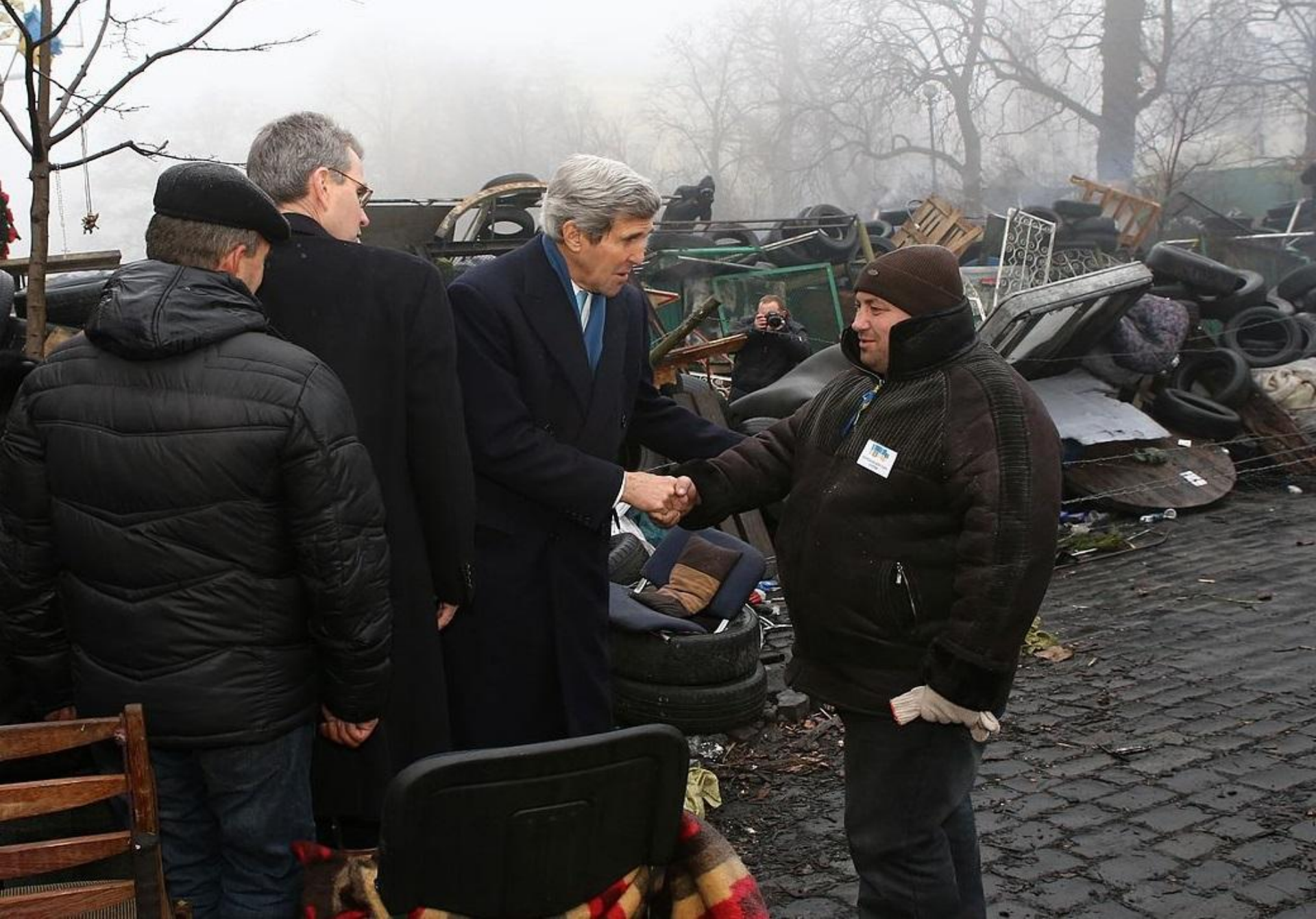
Голова Держдепу Джон Керрі на Євромайдані, 4 березня 2014