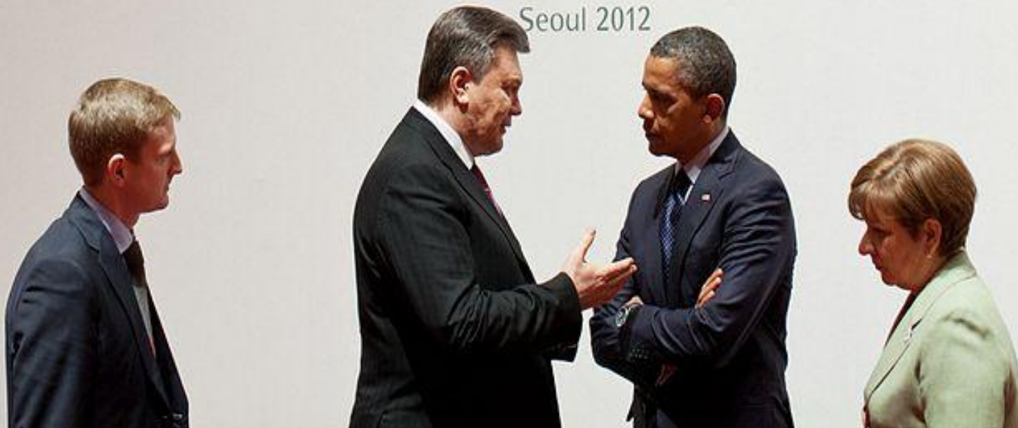
Барак Обама розмовляє з Віктором Януковичем. Саміт з ядерної безпеки, Сеул, 2012