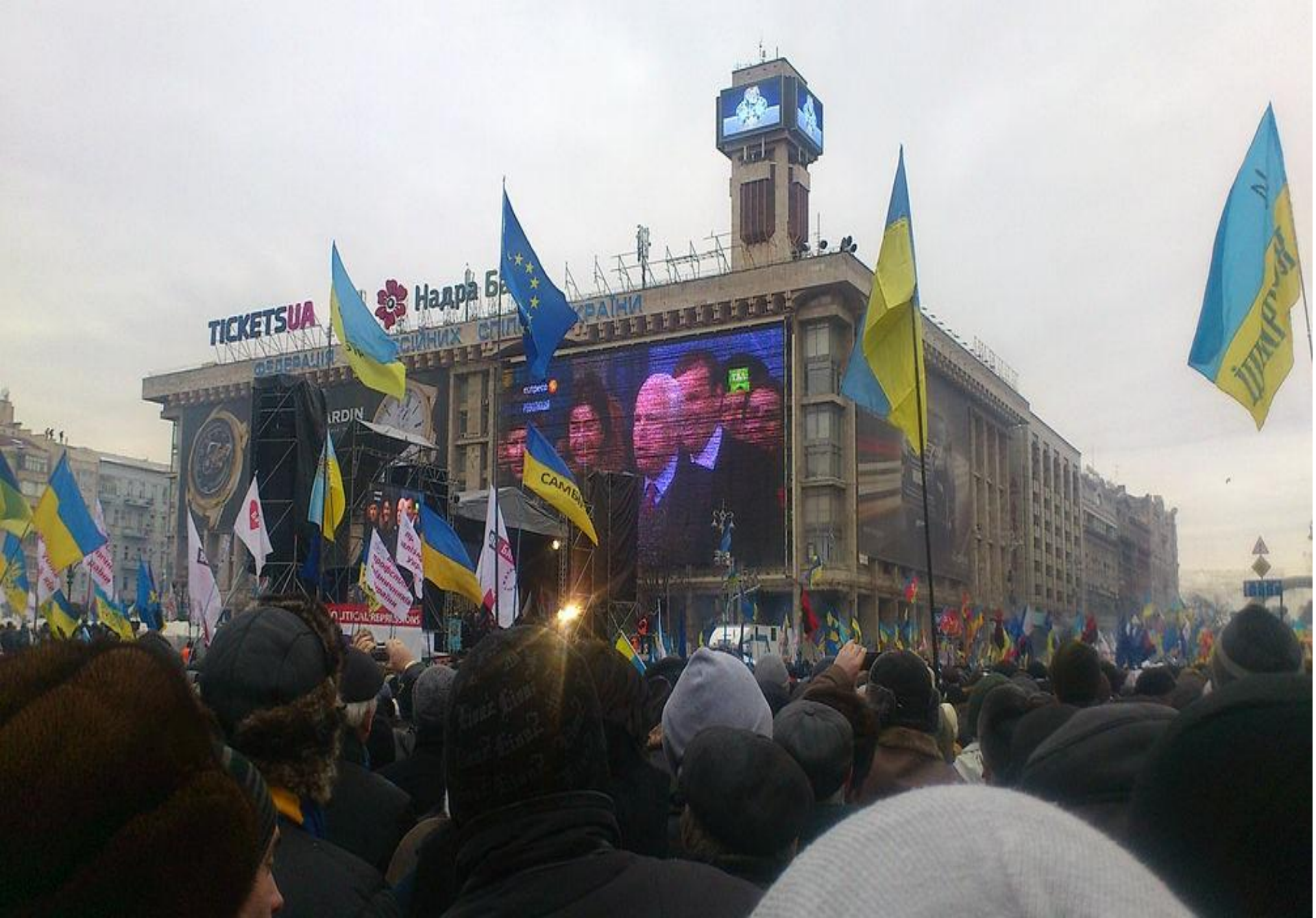
Сенатор США Джон Маккейн виступає на Євромайдані, 15 грудня 2013