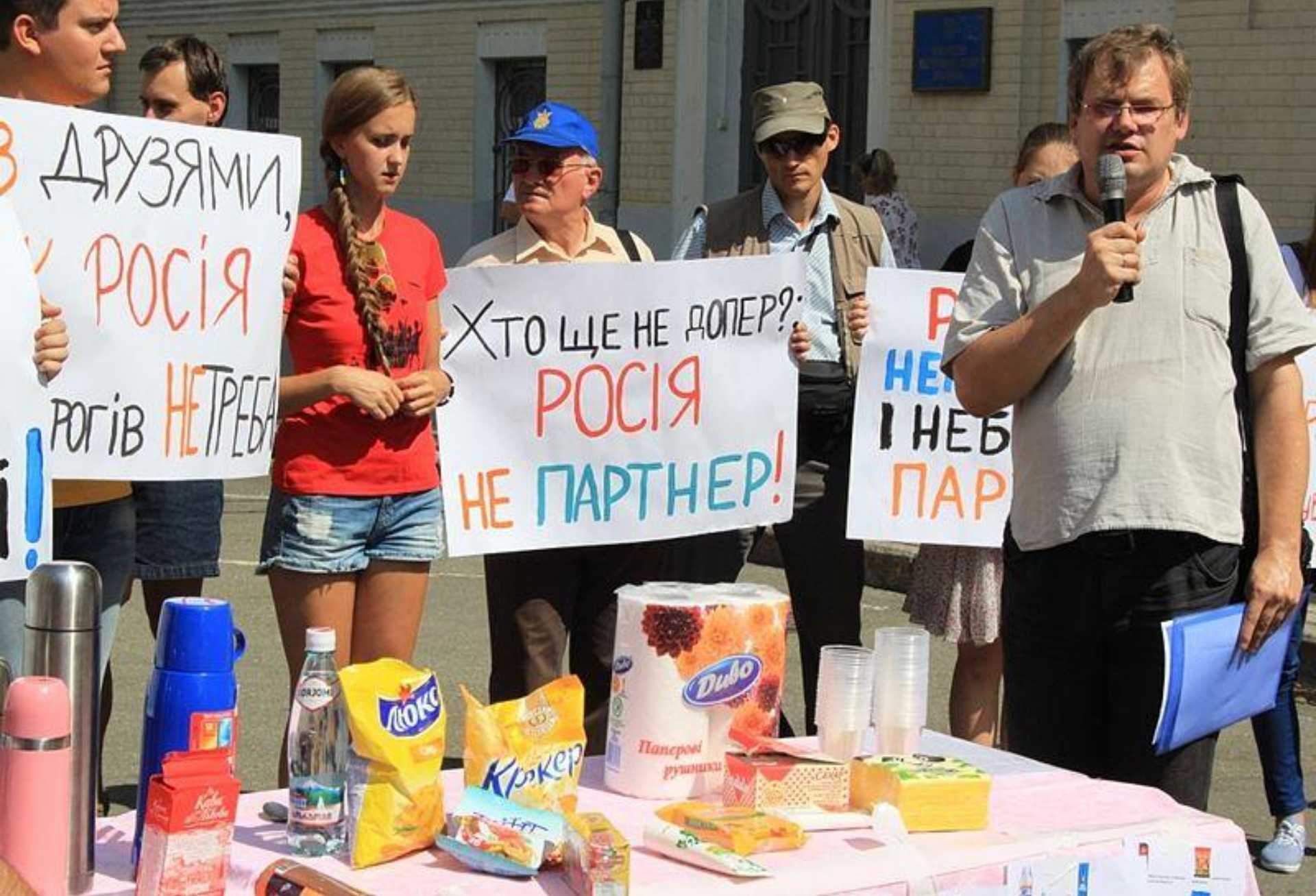
Акція руху «Відсіч» під Адміністрацією Президента України з вимогою адекватної відповіді України на торговельну блокаду Росією, 22 серпня 2013 року