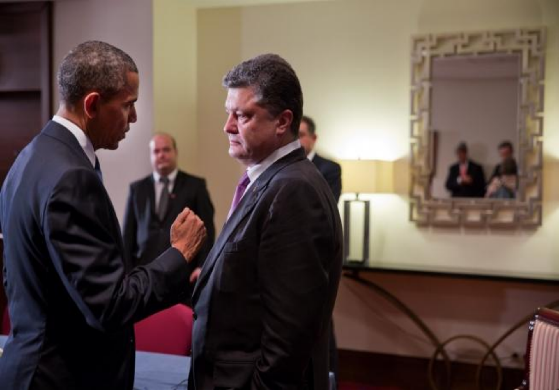
Президент США Барак Обама зустрічається з Петром Порошенко, 7 червня 2014