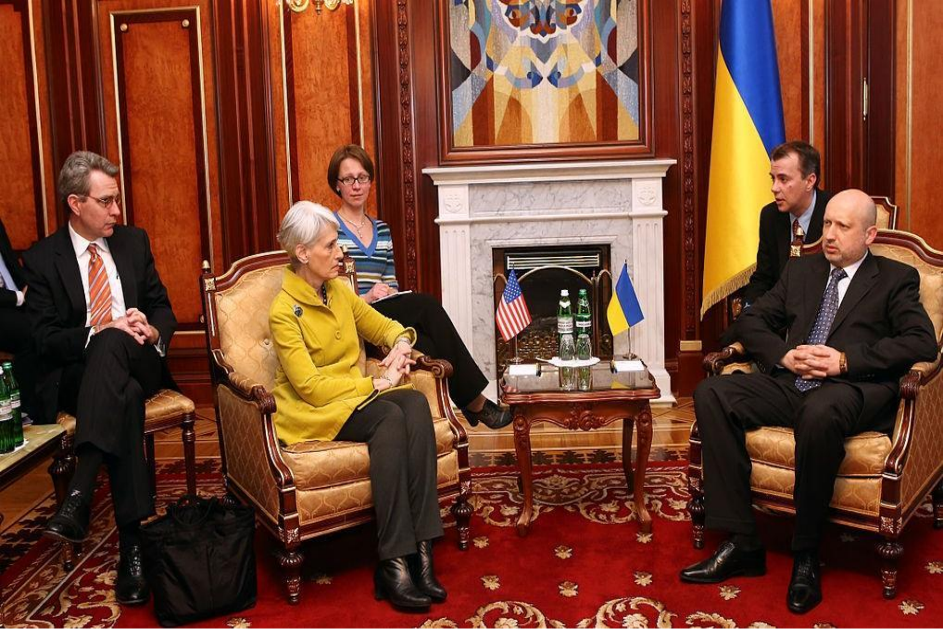
Зустріч посла Джефрі Паєта з в. о. президента Олександром Турчиновим, 20 березня 2014