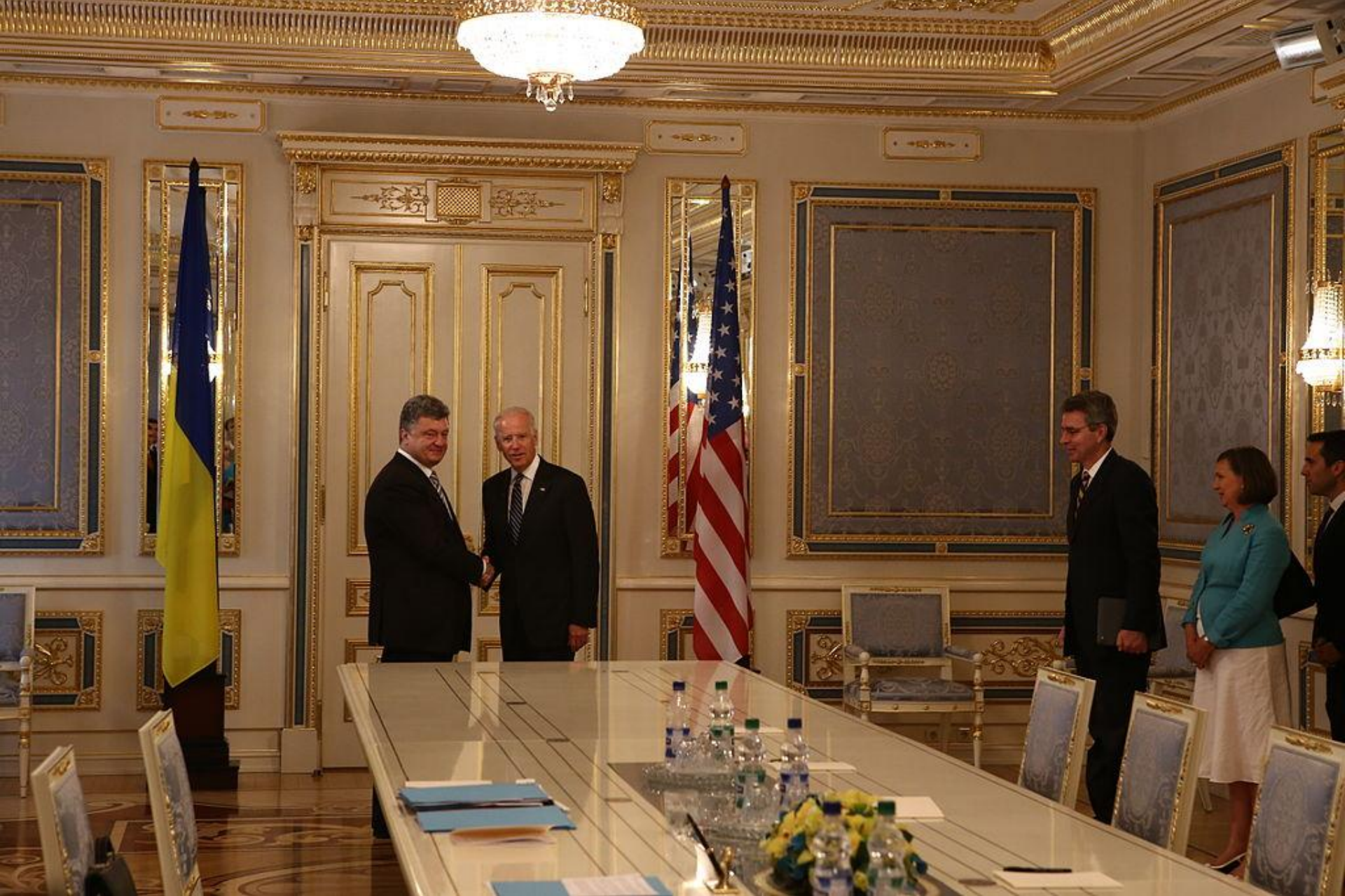
Зустріч з віце-президентом США Джо Байденом у день інавгурації Президента України, 7 червня 2014