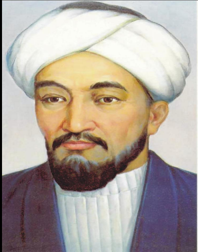
Әбу Насыр Әл-Фараби (870-950)