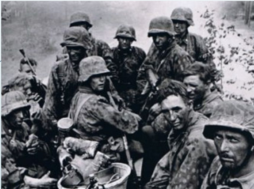
Фото німецьких танків і солдатів перед початком Курської битви