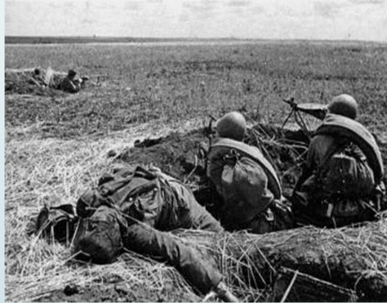
Фото битви на Курській дузі (зліва радянські солдати ведуть бій з німецького окопу, праворуч атака російських солдатів)