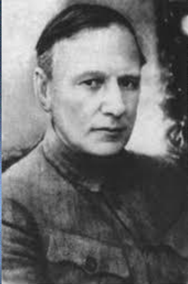
Християн Георгійович Раковський

Голова Ради народних комісарів і народний комісар зовнішніх справ УСРР протягом 1919-1923 р.р. Румунський підданий, у 1917 р. емігрував до Росії і став членом більшовицької партії. З 23 травня до 7 жовтня 1918 р. - голова делегації РРФСР з Українською державою. 25 січня 1919 р. - голова Раднаркому і нарком зовнішніх справ УСРР. У 1922 р. критикував Й. Сталіна, який тоді був наркомом національностей РРФСР, за втручання у внутрішні і зовнішні справи УСРР. Сприяв відкриттю повноважних дипломатичних представництв УСРР за кордоном ( в РРФСР, Польщі, Австрії, Туреччині, Литві та Латвії) . У 1923-1925 рр. був послом ССРР спочатку у Великобританії, а у 1925-1927 рр. – у Франції. У 1928 р., після повернення у Москву, почав формувати опозицію і був виключений з більшовицької партії і відправлений у заслання. У 1934 р. підкорився партійній дисципліні і повернувся в Москву, але у 1936 р. був знову заарештований за шпигунську діяльність і в 1938 р. розстріляний.