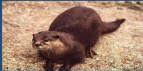
Выдровая землеройк а