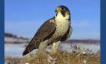
Сокол - сапсан