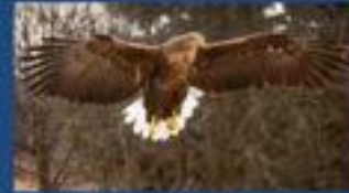
Орлан -белохво ст