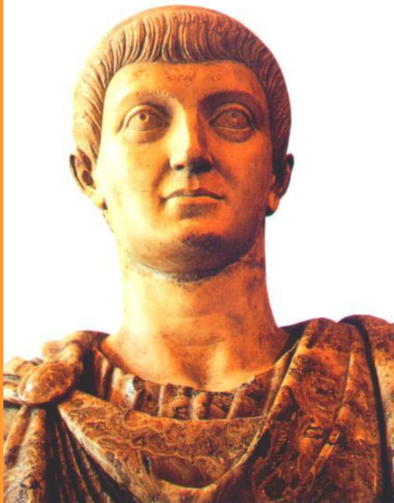
Император Константин Великий.

В н. 4 в.за императорский титул боролись несколько полководцев.