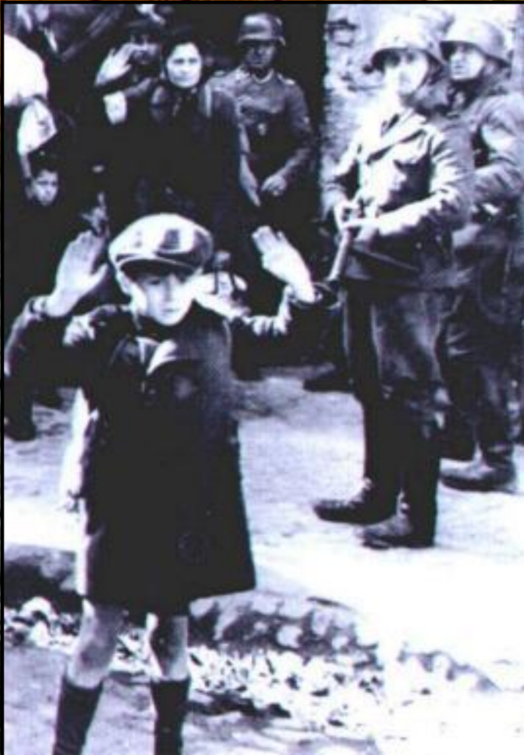
В Варшавском гетто.

Под впечатлением успехов союзников усилилась освободительная борьба в оккупированных странах. Но единства среди патриотов не было - часть из них выступала не только против фашизма, но и против коммунистов.