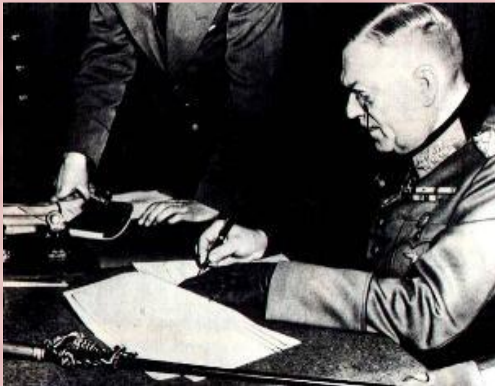
Кейтель подписывает капитуляцию Германии

8 мая в Карлсхорсте в присутствии маршала Жукова и представителей войск союзников, фельдмаршал Кейтель подписал капитуляцию.