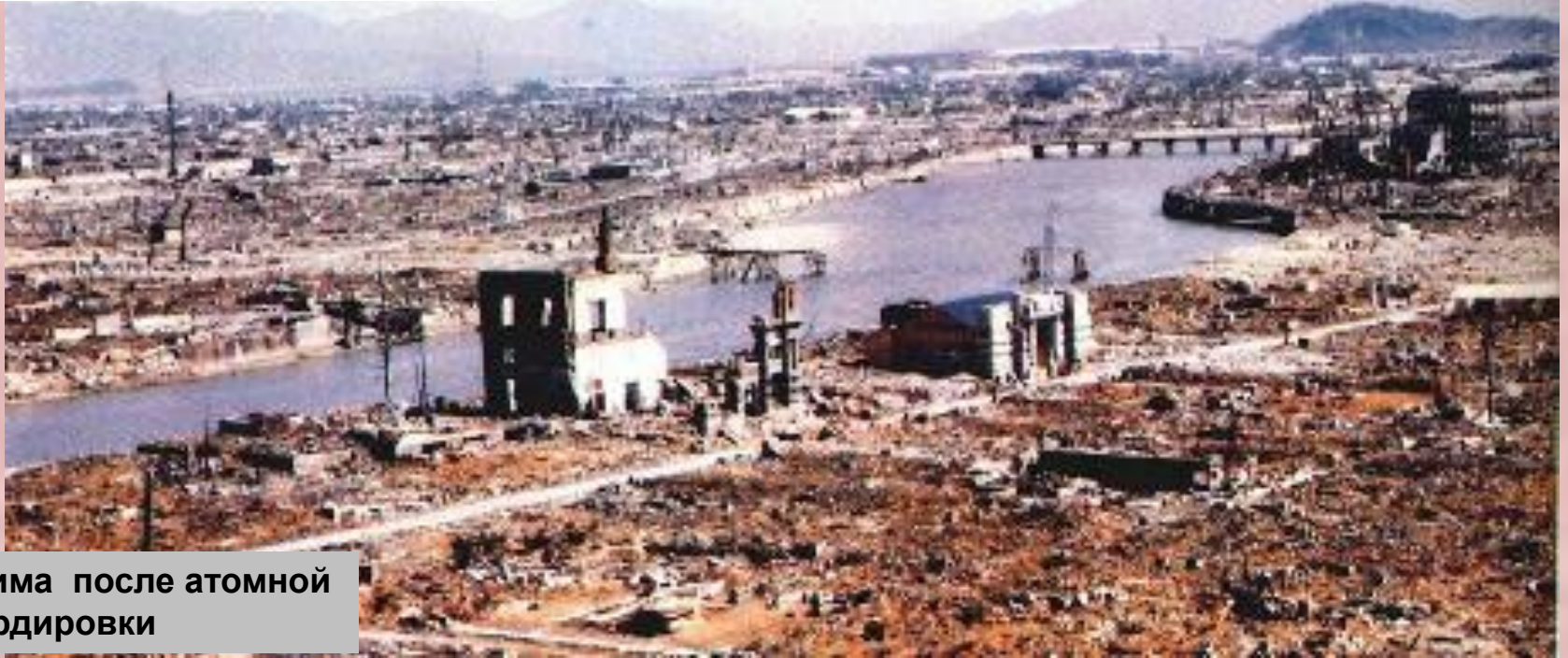
Хиросима после атомной бомбардировки

В феврале 1945 г. американцы высадились на Окинаве, но встретили яростное сопротивление. Стало ясно, что без помощи СССР война может затянуться на несколько лет. В июле 1945 г. СССР, Китай и США предъявили Японии ультиматум, но он был отклонен. 6 и 9 августа США сбросили атомные бомбы на Хиосиму и Нагасаки, 200 тыс. человек погибло сразу, сотни тысяч умерли от лучевой болезни после войны. Военной необходимости в этом не было, т.к. в этих городах не было ни войск, ни важных военных объектов. Этот варварский акт можно расценить как попытку установить новый мировой порядок и запугать СССР. Президент Трумэн заявил: «У меня теперь есть дубинка для русских парней!»