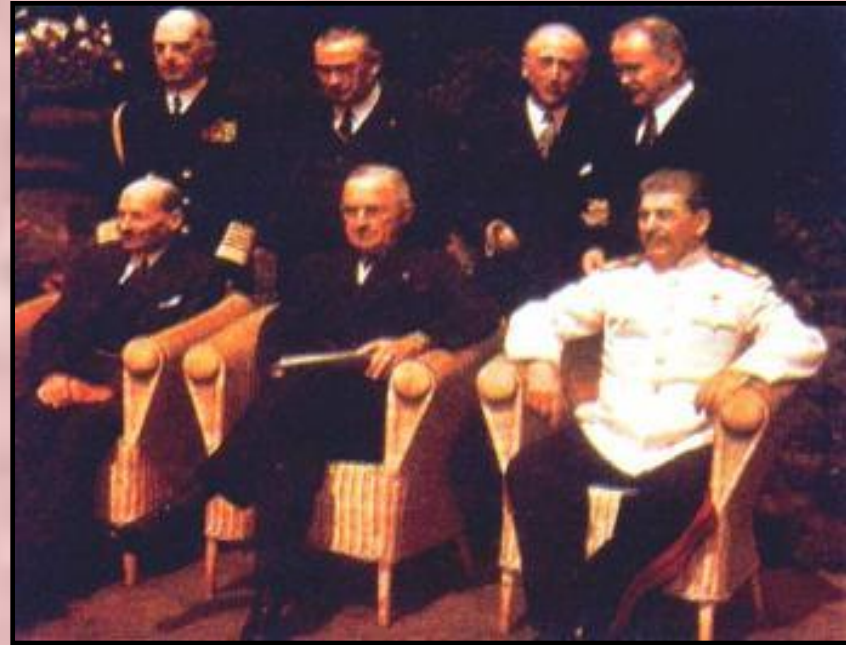
Сталин, Трумен, Эттли в Потсдаме.

В июле 1945 г. «Большая тройка» встретилась в Потсдаме в новом составе.