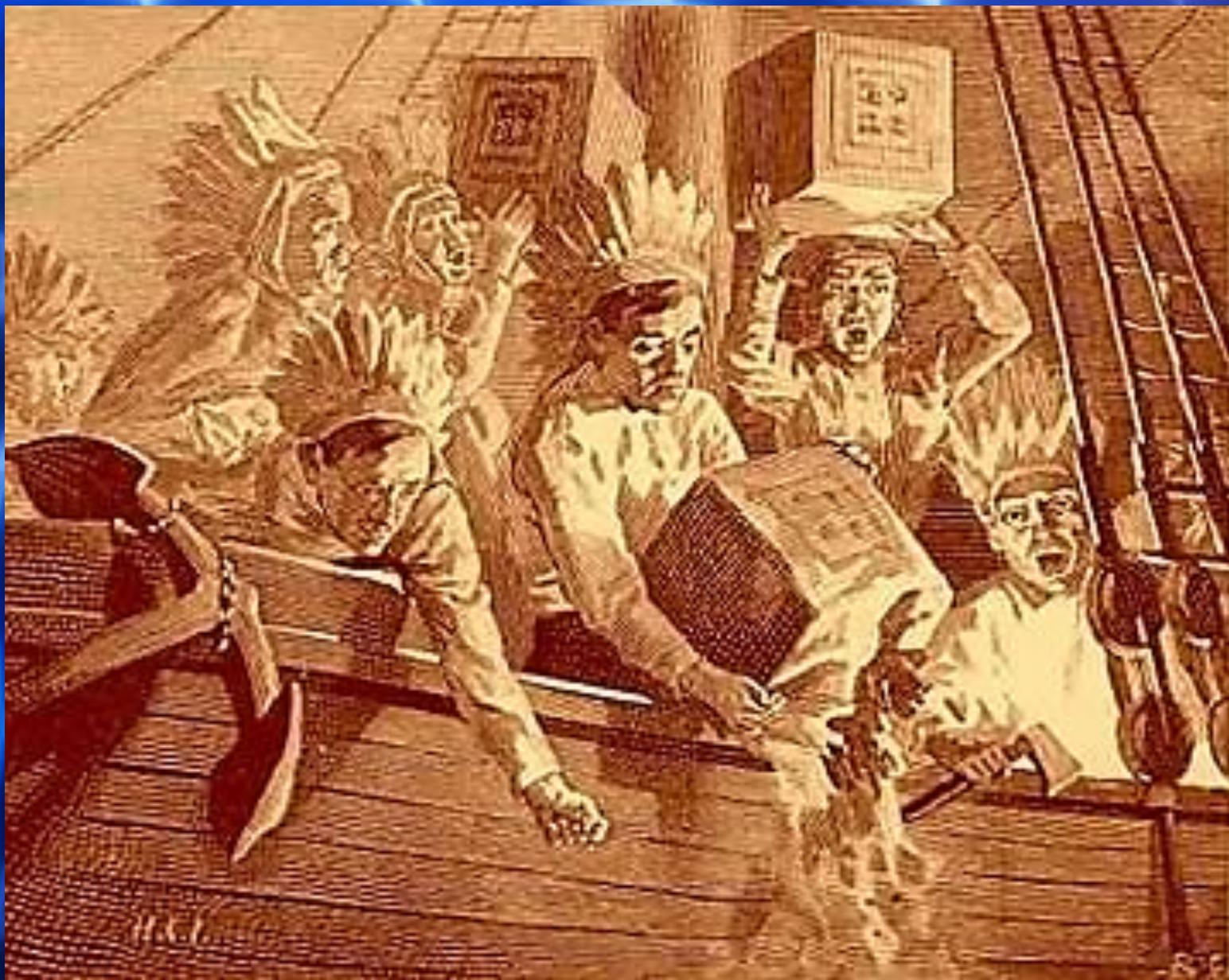
Бостонское чаепитие 1773 г.