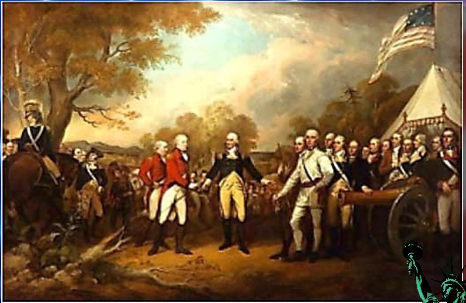
Битва при Саратоге