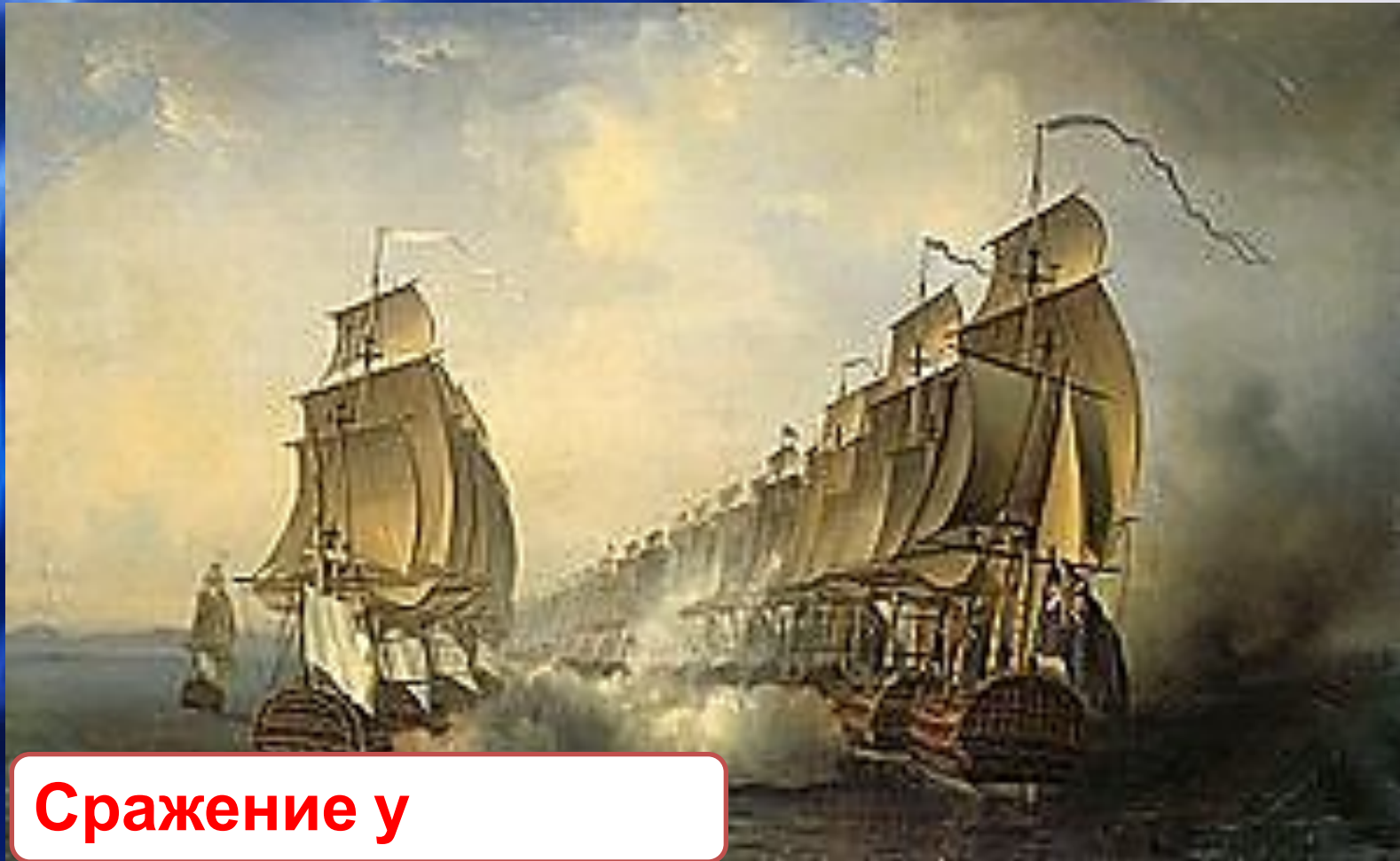
Сражение у Куддалора

20 июня 1783 года — Сражение у Куддалора — последнее сражение войны США за независимость