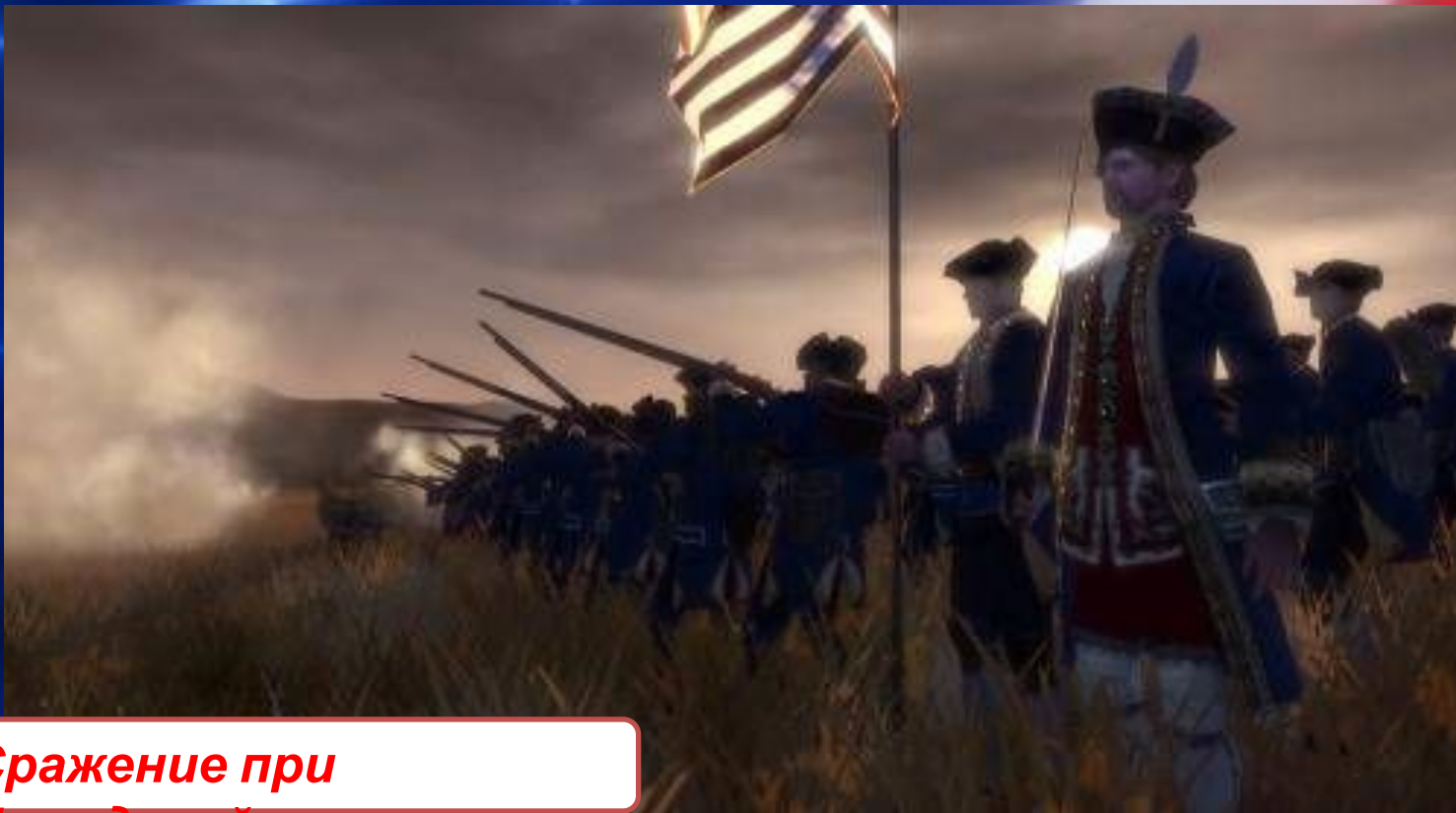
Сражение при Брендивайне

Весной 1776 года Король направил для подавления восстания флот с десантом из гессенских наёмников. Британские войска перешли в наступление. В 1776 году британцы заняли Нью-Йорк, а в 1777 году, в результате сражения при Брендивайне , Филадельфию. На фоне эскалации насилия 4 июля 1776 года депутаты колоний приняли декларацию независимости и образования США. В битве при Саратоге американские сепаратисты впервые одержали победу над королевскими войсками.