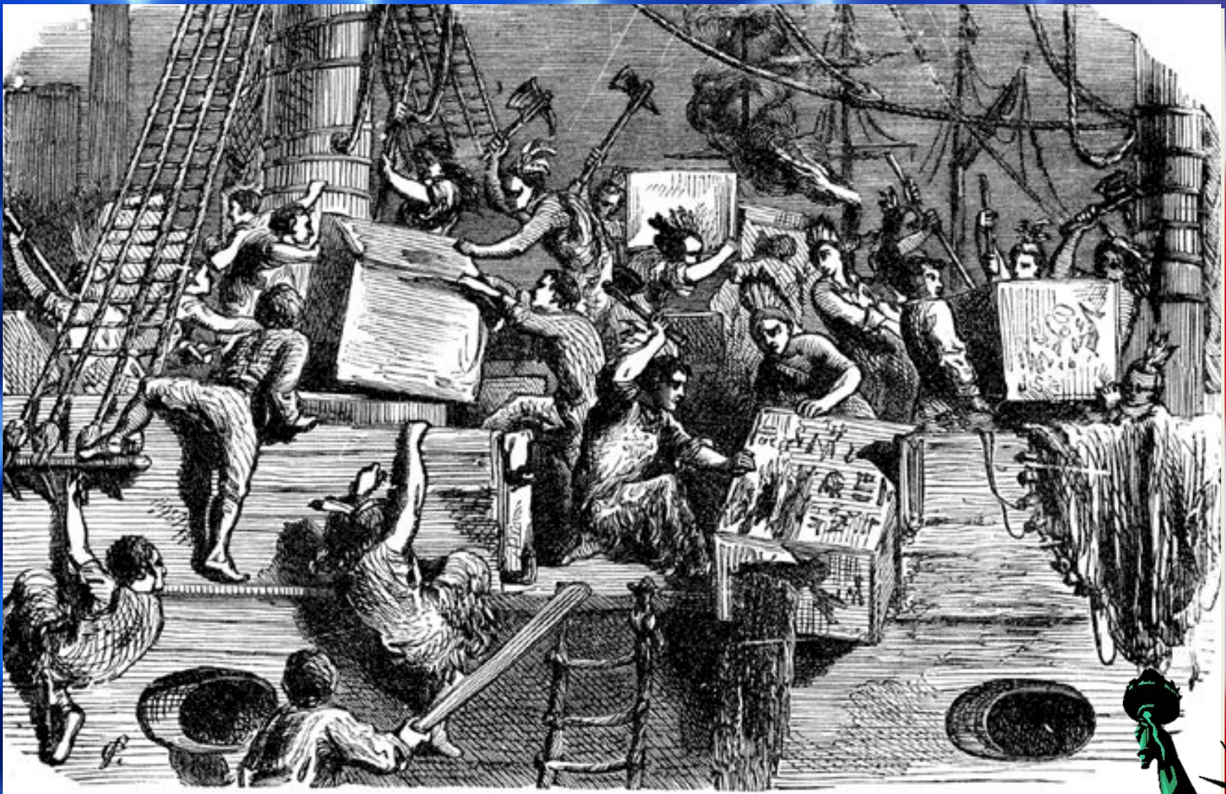
Бостонское чаепитие 1773 г.