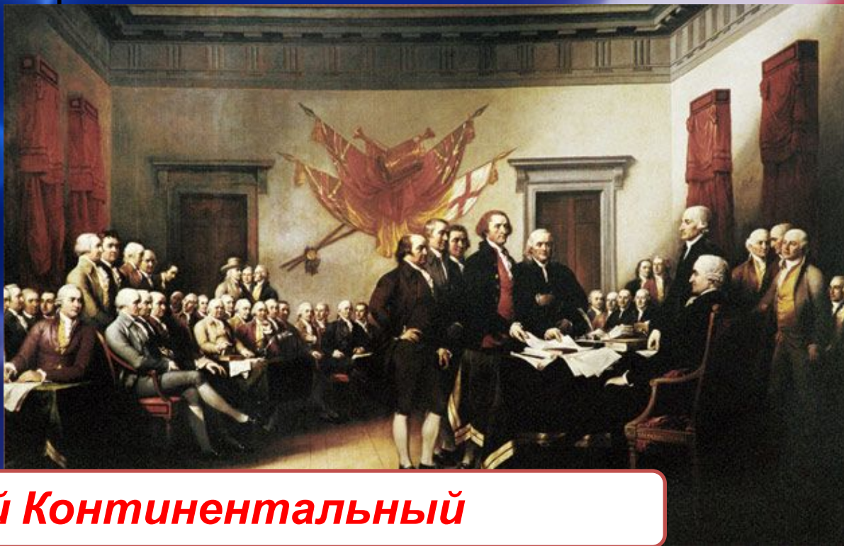
Второй Континентальный конгресс

10 мая, в Филадельфии собрался Второй Континентальный конгресс 13 колоний, который с одной стороны подал петицию королю Англии Георгу III о защите от произвола колониальной администрации, а с другой начал мобилизацию вооруженного ополчения, во главе которого стал Джордж Вашингтон. Король охарактеризовал ситуацию в североамериканских колониях как восстание