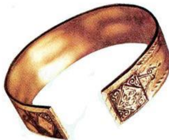
Рис.7 Булгарский золотой пластинчатый браслет