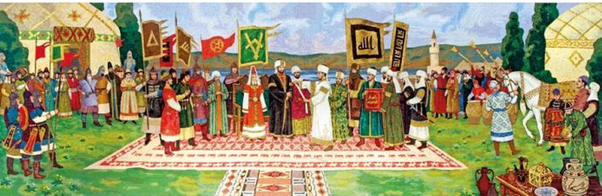
Рис.2 Мозаичное панно, художник Фарид Валиуллин. На нем изображена встреча с посланниками халифа. В центре — Алмуш-хан с супругой и сам Ибн-Фадлан в момент прочтения послания халифа Аль-Муктадира. Вокруг — представители болгарских родов, различных народов, проживавших на болгарской земле.