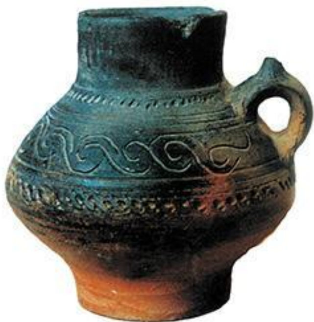
Рис.4 Булгарская орнаментированная гончарная керамика, XII – нач. XIII в.