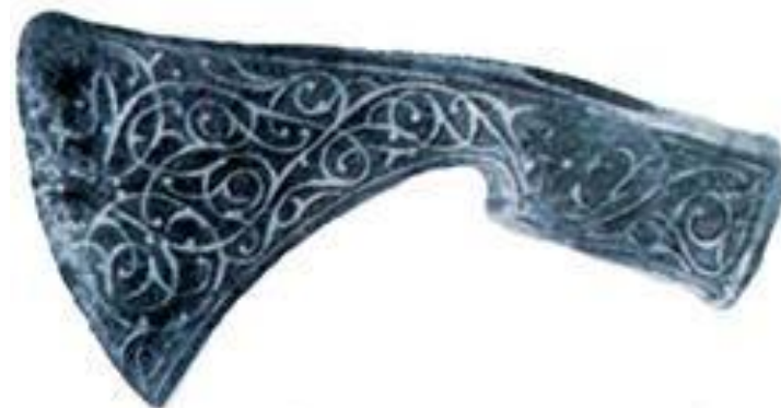
Рис.5 Булгарский орнаментированный боевой топор