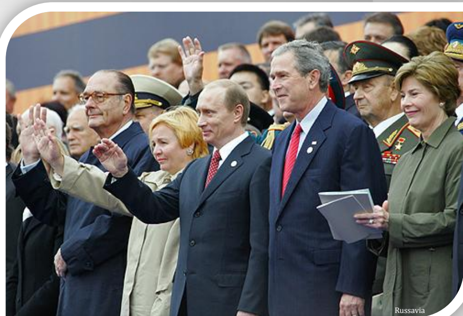
В. Путин во время Парада Победы

9 мая 2005 года в ходе торжеств по случаю 60-ти летия Победы Великой Отечественной войне Путин и другие мировые лидеры призвали к борьбе с «нацизмом XXI века» — терроризмом и поблагодарили победителей фашизма.