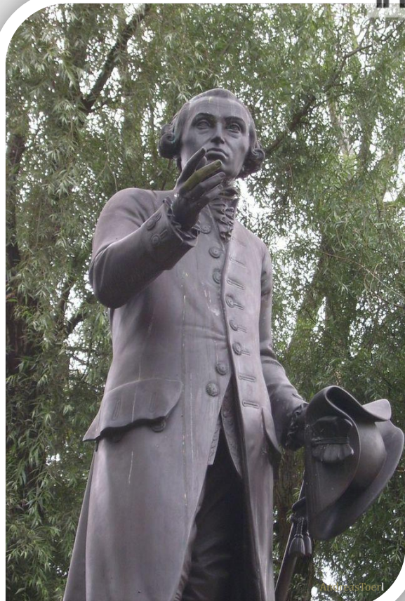
Памятник Канту в Калининграде

1 апреля 2013 г. В. Путин поручил проработать на федеральном уровне вопрос о том, чтобы сделать философа Иммануила Канта символом Калининградской области.