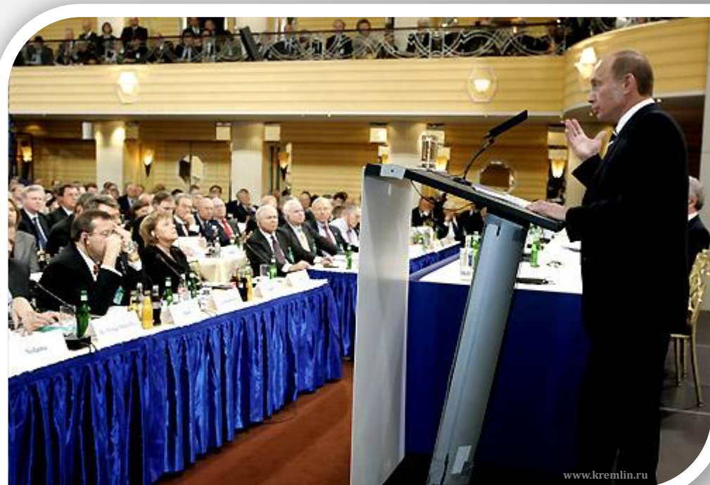
Выступление Путина в Мюнхене

На Мюнхенской конференции по политике безопасности 10 февраля 2007 г. Путин сформулировал возражения на размещение американских военнослужащих и элементов американской системы противоракетной обороны в Восточной Европе, в Польше и Чехии, а также относительно милитаризации космоса.