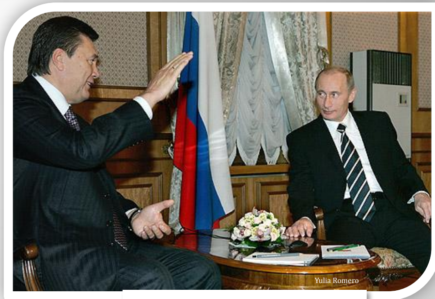
В. Янукович и В. Путин

В ходе президентских выборов на Украине в конце 2004 года российские власти поддерживали Виктора Януковича – кандидата от Партии регионов Украины.