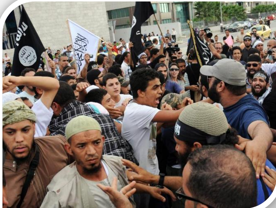
Вооружённые столкновения в Ливии

В начале 2011 г. возникла новая трещина в Российско-американских отношениях.