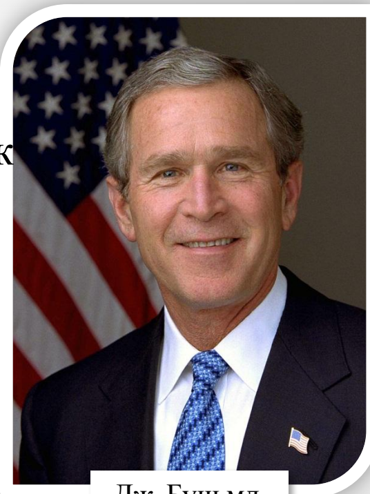
Дж. Буш мл.

Принятие в 2002 г. в НАТО семи восточноевропейских стран, Путин воспринял как «личное предательство» со стороны президента США Дж. Буша и премьер-министра Великобритании Тони Блэра.