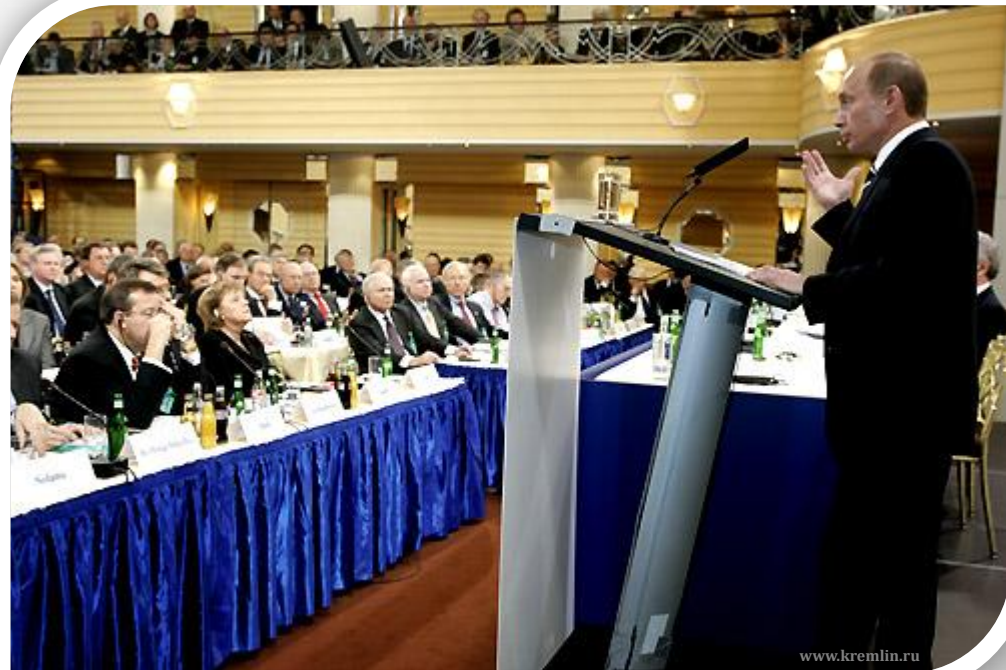
Выступление Путина в Мюнхене

Со второй половины 2000-х г. в публичных выступлениях Путин выражал недовольство военными аспектами американской внешней политики и проявлял опасения по поводу навязывания США своего видения миропорядка другим государствам.