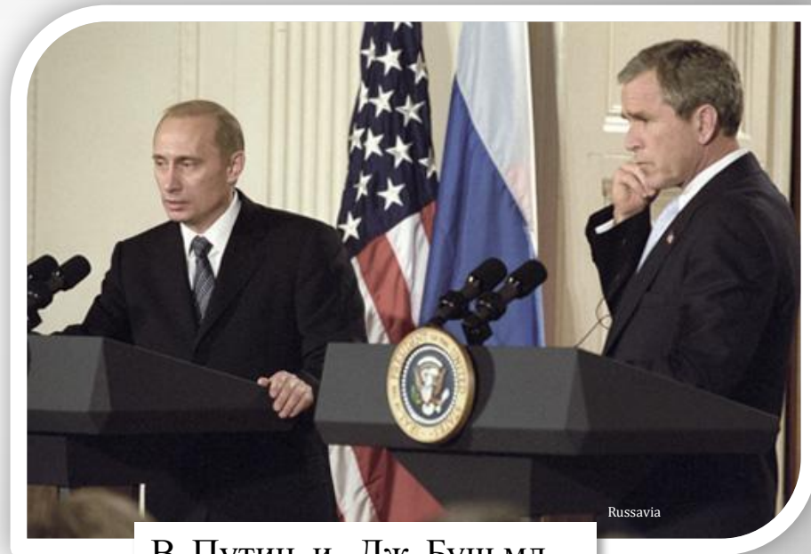
В. Путин и Дж. Буш мл.

В июне 2001 года Путин первый раз встретился с Президентом США Джорджем Бушем (младшим) в столице Словении Любляне.