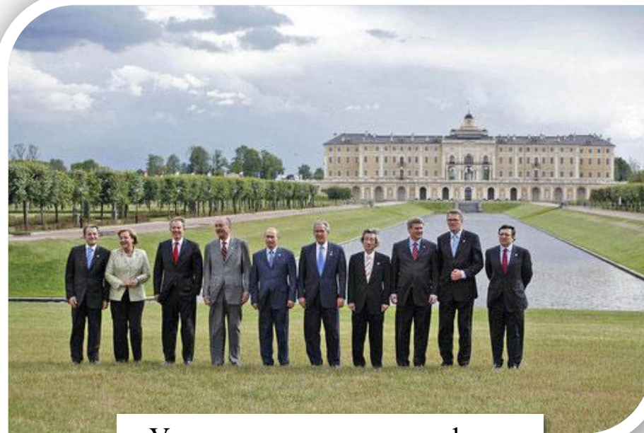
Участники саммита на фоне Константиновского дворца

В 2006 году Россия председательствовала в «Группе восьми» («Большая восьмёрка»).