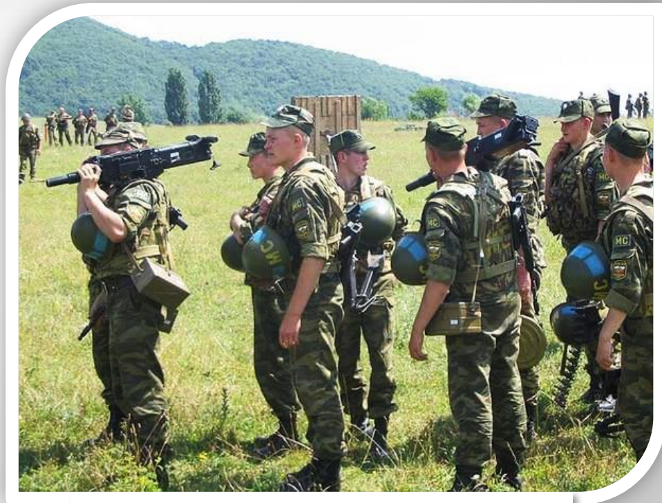
Российские миротворцы в Осетии

7 и 8 августа 2008 г. Д. Медведевым и В. Путиным принято совместное решение о начале военной операции по принуждению Грузии к миру.