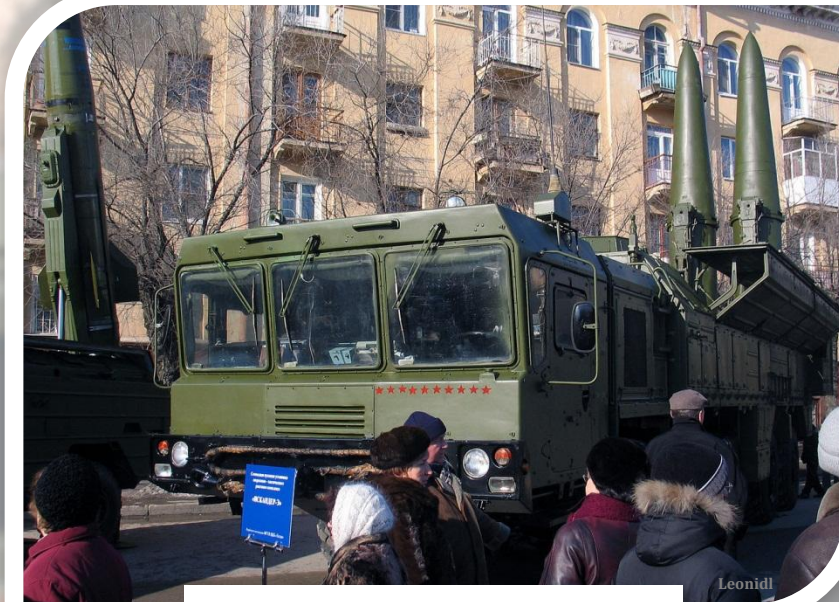
Ракетный комплекс «Искандер» 9К720

В феврале 2012 г. в качестве ответной меры в Калининградской области начались приготовления к размещению там ракетных комплексов «Искандер» 9К720.