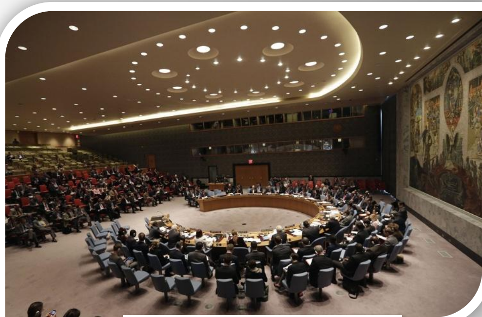
Совет безопасности ООН

4 февраля 2012 г. при голосовании в Совбезе ООН резолюции по Сирии Россия использовала право вето.