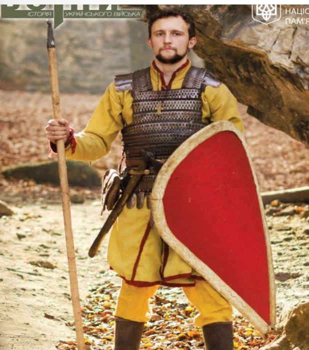
Князівський дружинник, Русь, XI ст.