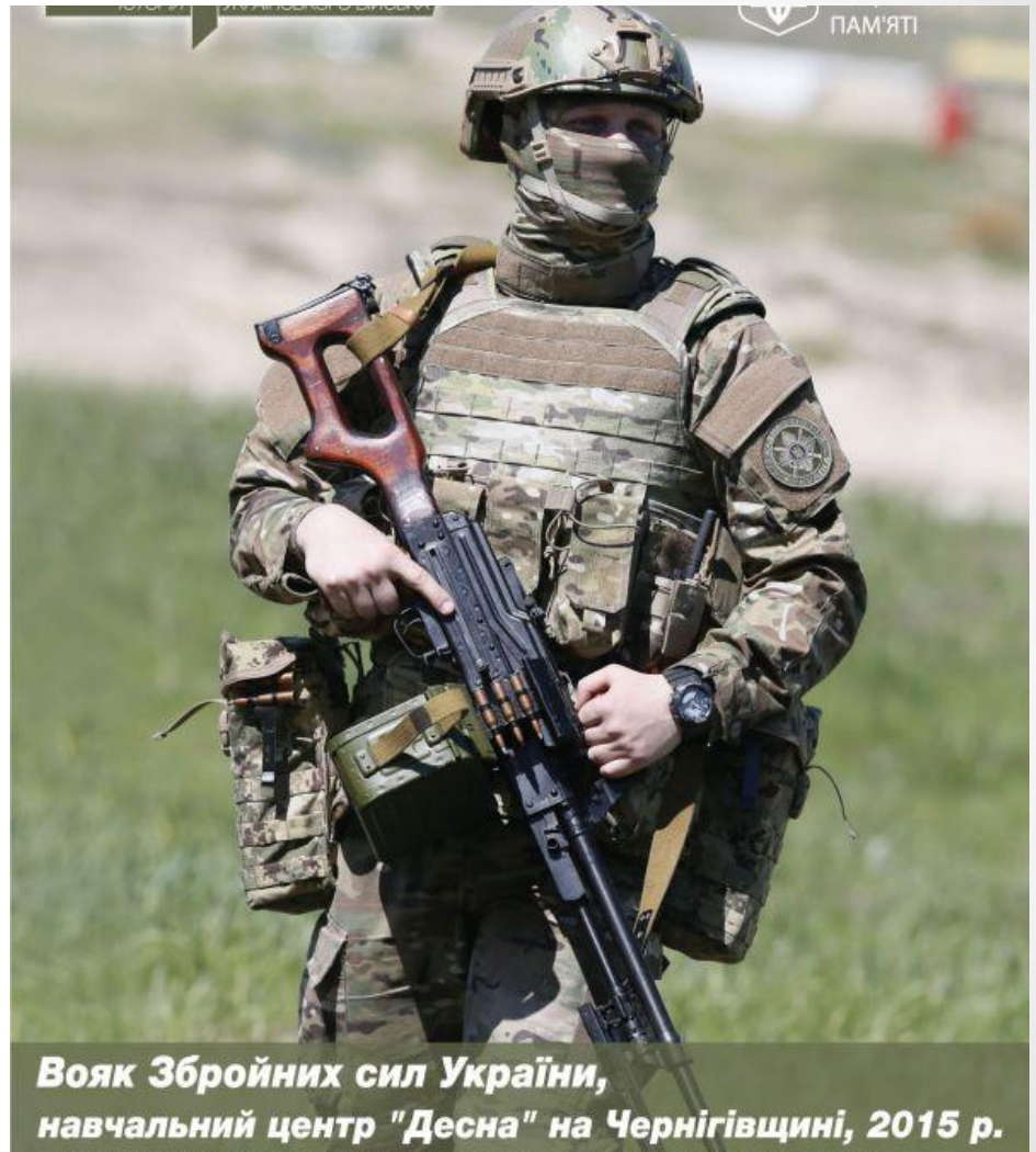
Вояк Збройних сил України, навчальний центр "Десна" на Чернігівщині, 2015 р.

У новій війні за незалежність, що почалася 2014 року, твориться нова українська армія. Терористів та іноземних найманців може перемогти не пострадянське, а тільки справді українське військо. Його розбудова можлива лише на основі українських військових традицій – від Русі до наших днів.