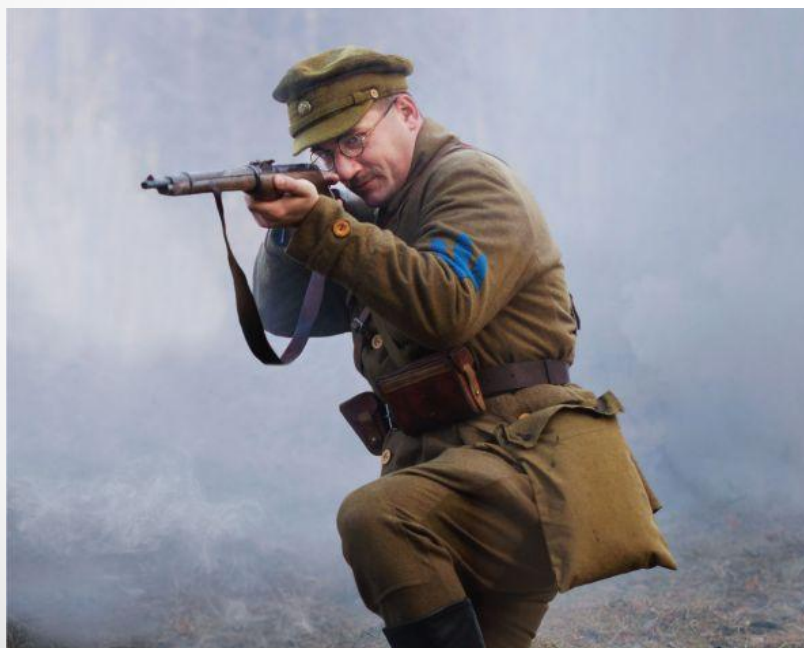
Козак Дієвої Армії Української Народної Республіки, 1919 р.

Армія Української Народної Республіки - у період з лютого 1917 по квітень 1918 року — збройні формування Української Народної Республіки, створені на основі демобілізованих українізованих частин російської армії, українізованих частин австро-угорської армії («українських січових стрільців» та інших), формувань (військовополонених-українців Німеччини та Австро-Угорщини), колишніх військовополонених-галичан («січових стрільців») та загонів добровольців — «гайдамаків», «вільного козацтва» та інших; з жовтня 1918 по листопад 1920 року — регулярна армія Української Народної Республіки.