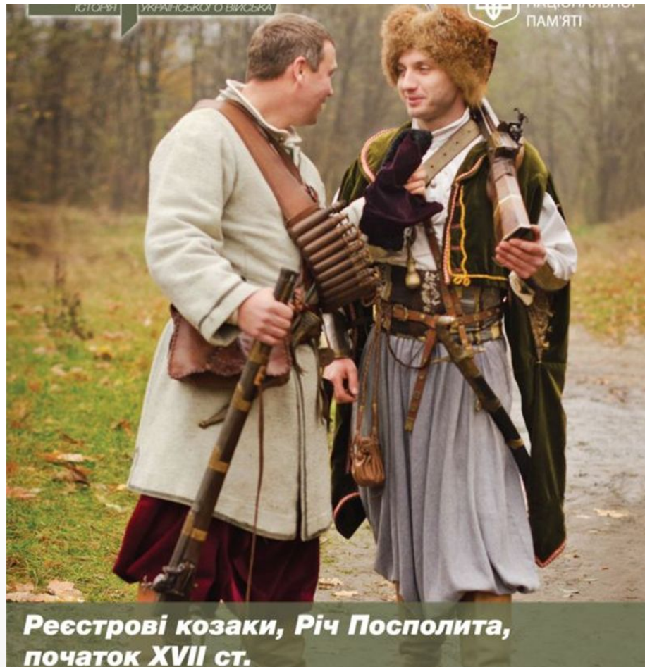
Рєсстрові козаки, Річ Посполита, початок XVII ст.