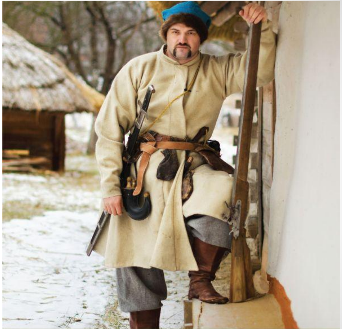
Реєстровий козак, Гетьманщина часів Богдана Хмельницького, друга пол. XVII ст.

Розбудова козацької держави після повстання під проводом гетьмана Богдана Хмельницького привела й до реформи козацького війська. Зокрема – до появи в ньому однострою (уніформи). 60 ти. козаків змусили рахуватися із собою всіх сусідніх правителів.