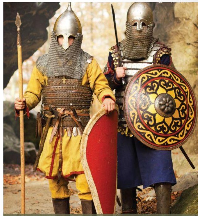
Князівські дружинники, Русь, XIII ст.