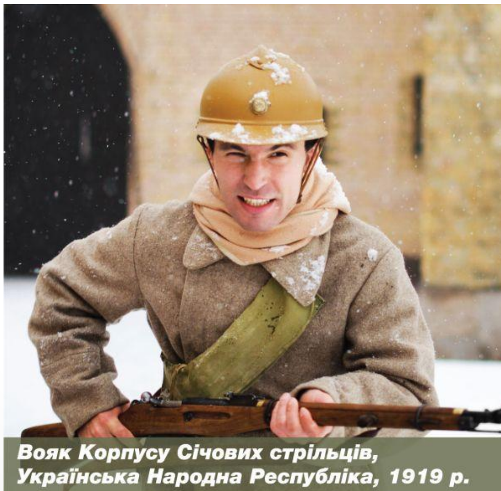
Вояк Корпусу Січових стрільців, Українська Народна Республіка, 1919 р.

Корпус Січових стрільців не був продовженням Легіону УСС, а творився самостійно в Києві. Найвідомішим його командиром був Євген Коновалець, який відзначився у боях проти червоногвардійців. Січові стрільці були одним із найперших і найбільших боєздатних підрозділів збройних сил Української Народної Республіки. Протягом 1917-1919 рр. він виріс із курення (батальйону) до армійської групи.