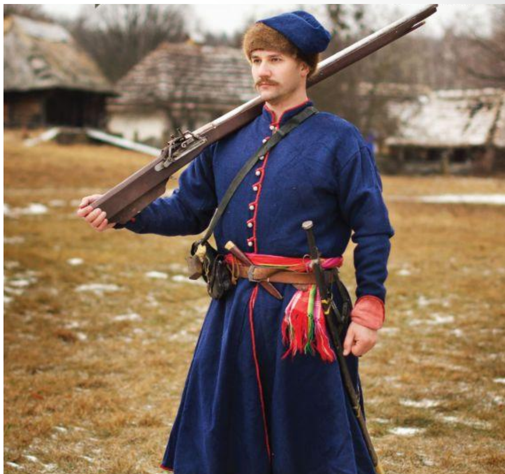
Регстровий козак, Гетьманщина часів Богдана Хмельницького, друга пол. XVII ст.

Козацьке військо особливо вправне було в інженерно-технічній справі. Козацький табір був і способом пересування і місцем відпочинку, і захистом під час бою. Досить було оточити себе возами та з'єднати їх мотузками та ланцюгами. Найвразливіші місця табору прикривалися артилерією.