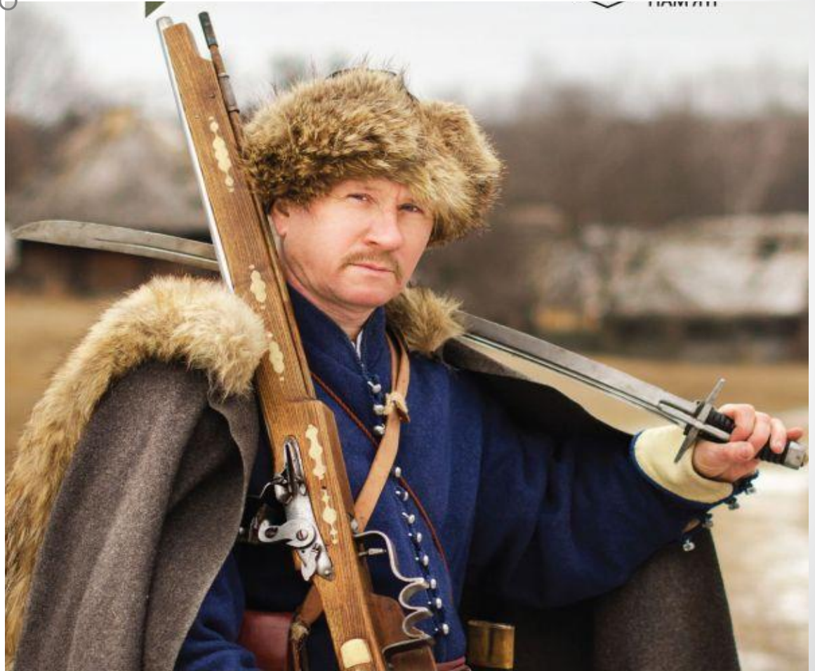
Реєстровий козак, Гетьманщина часів Богдана Хмельницького, друга пол. XVII ст.

виявився настільки вдалий, що з незначними змінами проіснував до кінця XVIII ст.