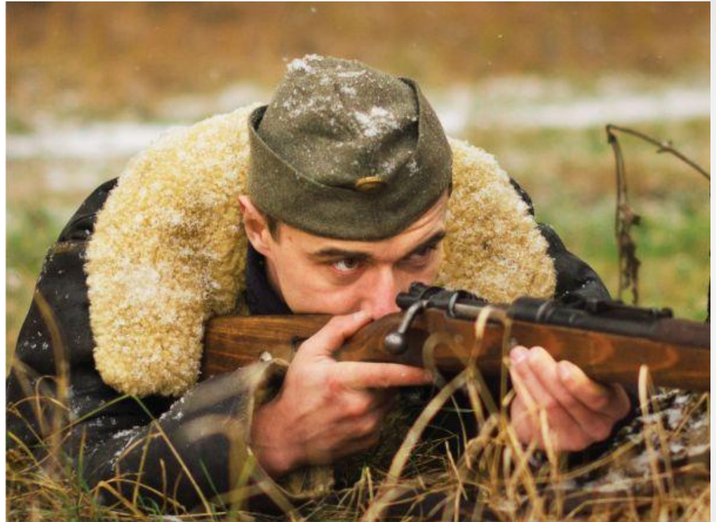
Вояк Української повстанської армії, 1940-1950-ті рр.

У 1940 році за дорученням уряду УНР в екзилі Тарас Бульба-Боровець сформував на Поліссі збройну формацію, яка мала розпочати боротьбу за незалежність України. Це військо дістало назву Поліська Січ та нараховувало до 10 000 бійців. Саме на основі цієї організації сформувалося озброєне крило Організації українських націоналістів — Українська Повстанська Армія (УПА).