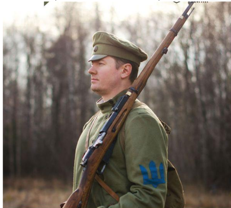
Козак Дієвої Армії Української Народної Республіки, 1919 р.