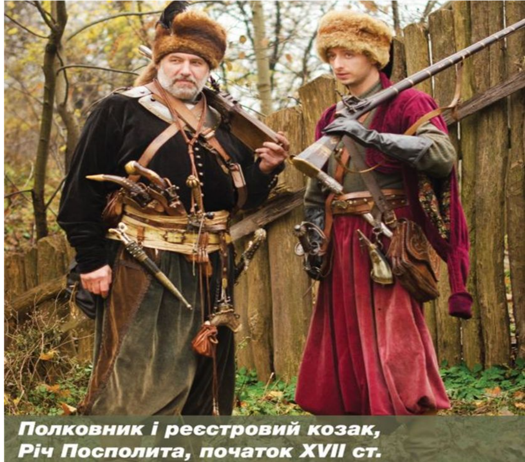
Полковник і реєстровий козак, Річ Посполита, початок XVII ст.

Усім військом керував кошовий отаман з судьями, осавулами, писарями. Козаки офіційно титулювали один одного «товаришем», а гурт козаків «товариством».