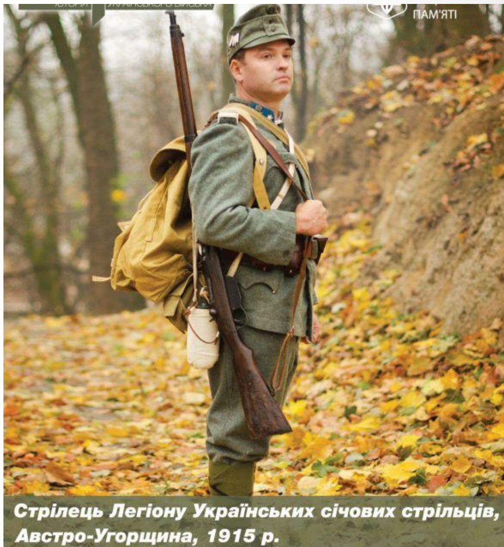
Стрелець Легіону Українських січових стрільців, Австро-Угорщина, 1915 р.

Після більш як столітньої перерви українське військо відродилося знову. Цього разу – як невелике з'єднання в складі австрійської армії – Легіону УСС. З 28 тис. добровольців австрійська влада обрала для служби лише 2,5 тис. Легіонерів було поділено на два курені (батальйони) та один напівкурінь. Курені ділилися на сотні (роты) по 220 осіб. До складу сотні входили чотири чоти (взводи). Чота складалася з чотирьох роїв (відділень), а один рій налічував 10-15 стрільців.