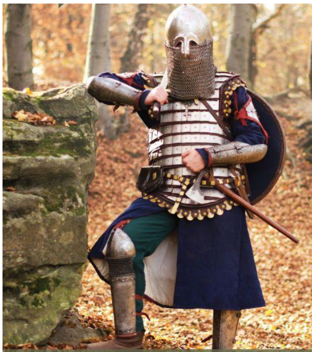
Князівський дружинник, Русь, XIII ст.