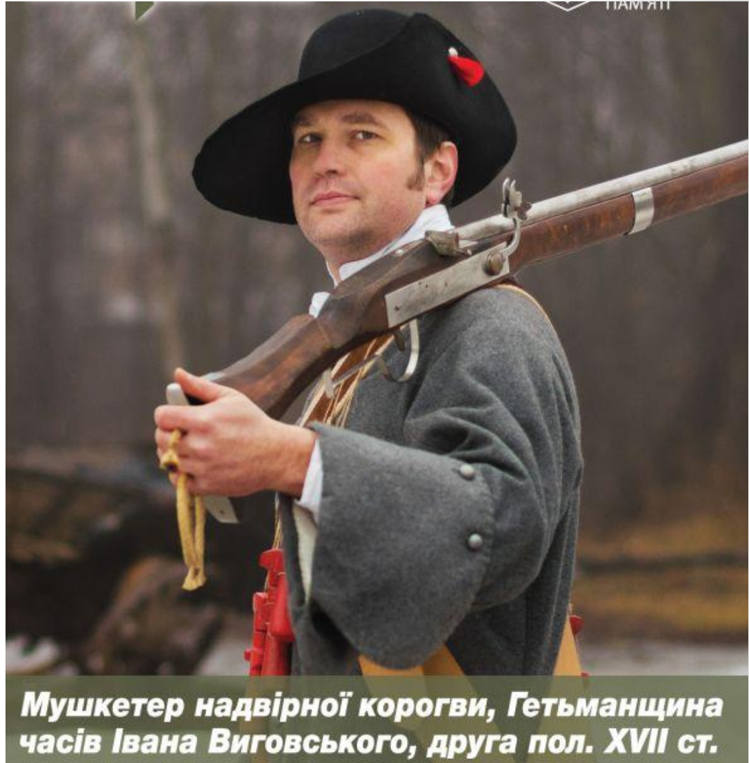
Мушкетер надвірної корогви, Гетьманщина часів Івана Виговського, друга пол. XVII ст.

Війни з Московією були для українських козаків звичною справою, починаючи з походу на Москву гетьмана Петра Сагайдачного 1618р. У 1659-му відбулася найвидатніша битва найбільшої українсько-російської війни – Конотопська. Об'єднанні загони українських козаків і кримськотатарських вершників під загальним командуванням гетьмана Івана Виговського вщент розбили значно чисельнішу московську армію. Не останню роль відіграли організовані н західноєвропейський манер регулярні частини мушкетерів.