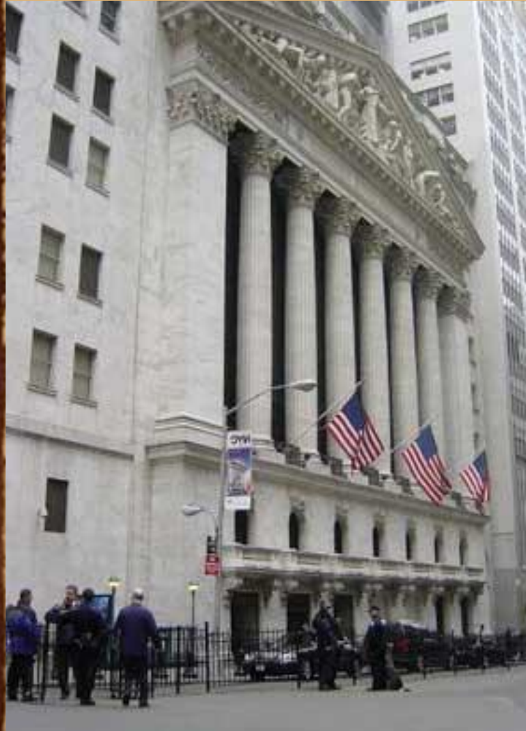
Нью-Йоркская фондовая биржа