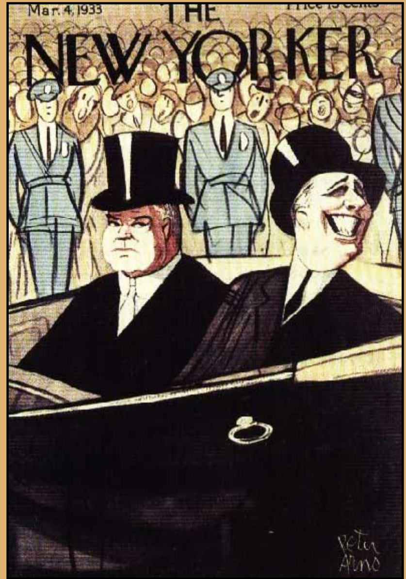
Гувер и Рузвельт