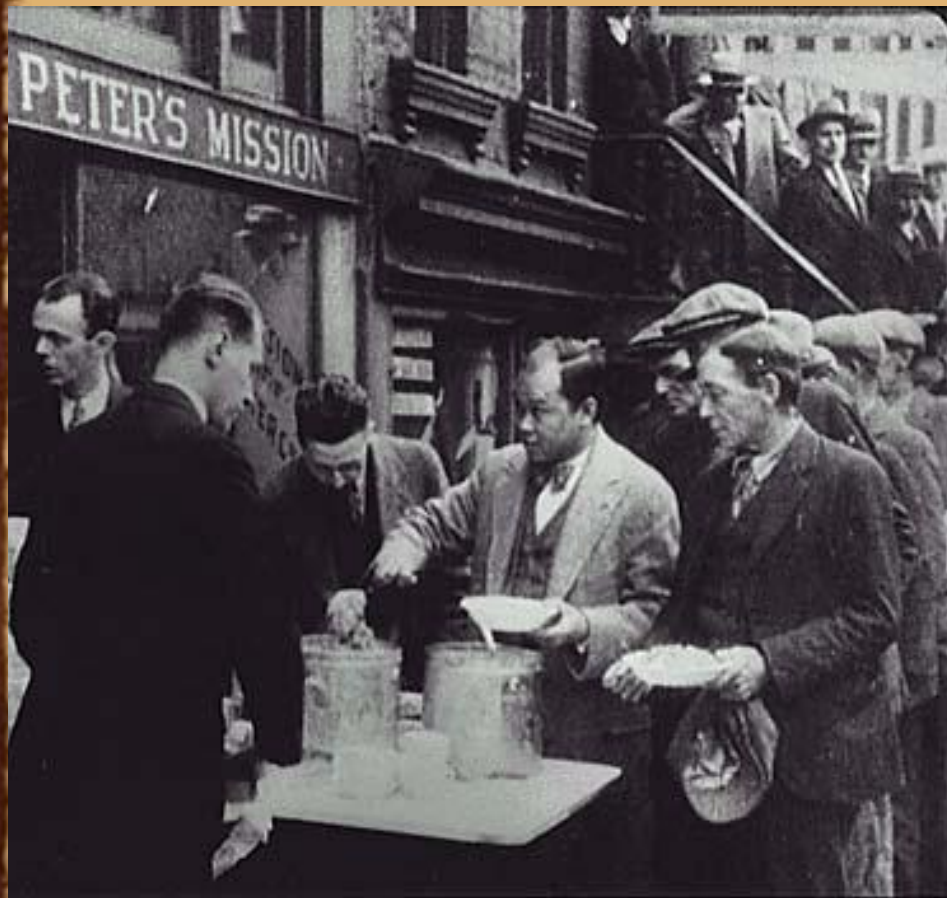
Очереди в столовые