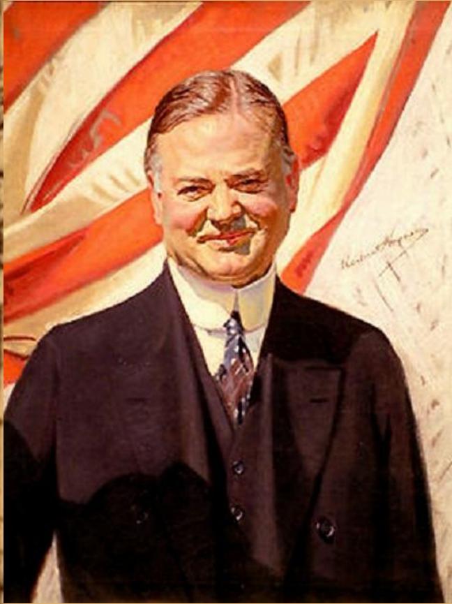
Герберт Кларк Гувер