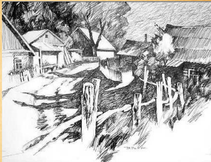
Малюнак В. Быкава “Мая Радзіма”

Васіль Быкаў нарадзіўся 19 чэрвеня 1924 года ў вёсцы Бычкі Ушацкага раёна Віцебскай вобласці ў сялянскай сям'і. З дзяцінства захапляўся маляваннем. Скончыў 8 класаў школы ў вёсцы Кублічы, затым вучыўся на скульптурным аддзяленні Віцебскай мастацкай вучэльні (1939-1940), якое пакінуў з-за адмены стыпендыі. У чэрвені 1941 года экстрэнам здаў экзамены за 10 клас.