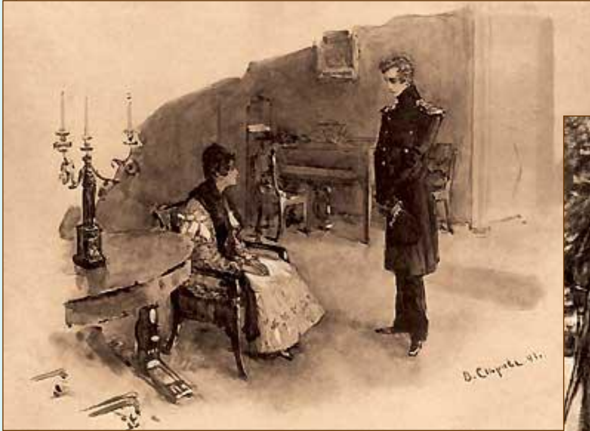
Объяснение Печорина с Мери