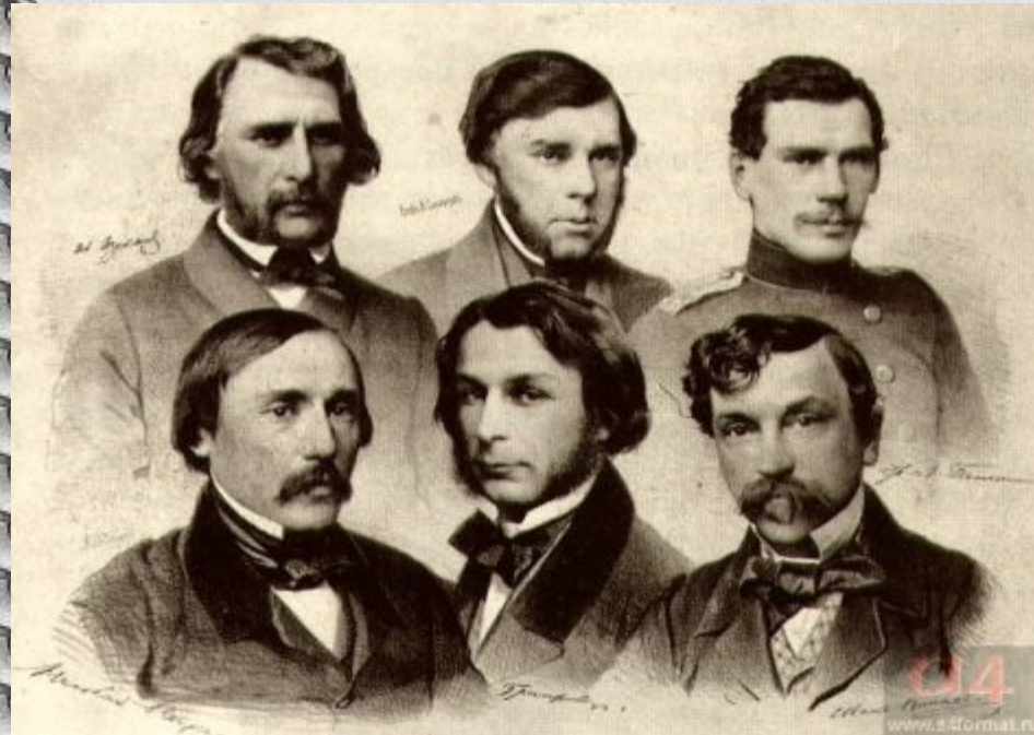
Писатели - сотрудники журнала "Современник".

Конец дворянского периода освободительного движения, и начало разночинского, буржуазно-демократического, не могли не оказать серьезного влияния на развитие русского демократического лагеря литературы. Все это сделало решительные шаги по пути демократизации, приближения к боевым и актуальным вопросам общественной жизни. Окончательное размежевание либеральной и демократической тенденций в русском общественном движении привело к перегруппировке сил и в литературе.