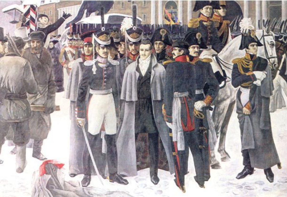
Декабристы на Сенатской площади.