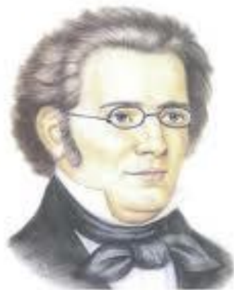
ШУБЕРТ ФРАНЦ (1797 – 1828)