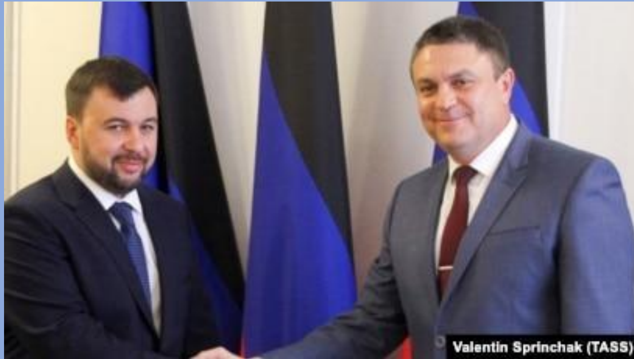
Глава ДНР Денис Пушилин и глава ЛНР Леонид Пасечник

Это даёт этим республикам право на независимость от Украины, и защищать себя от военного нападения Украины, которое продолжалось 8 лет, и жить без войны.