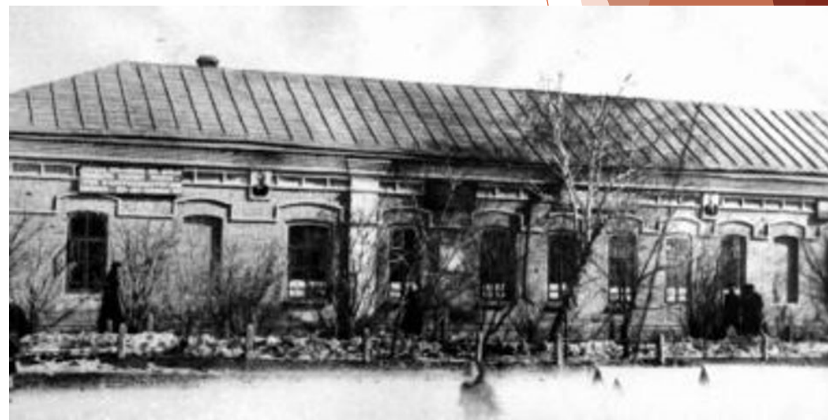
Қостанайдағы орыс-татар мектебі