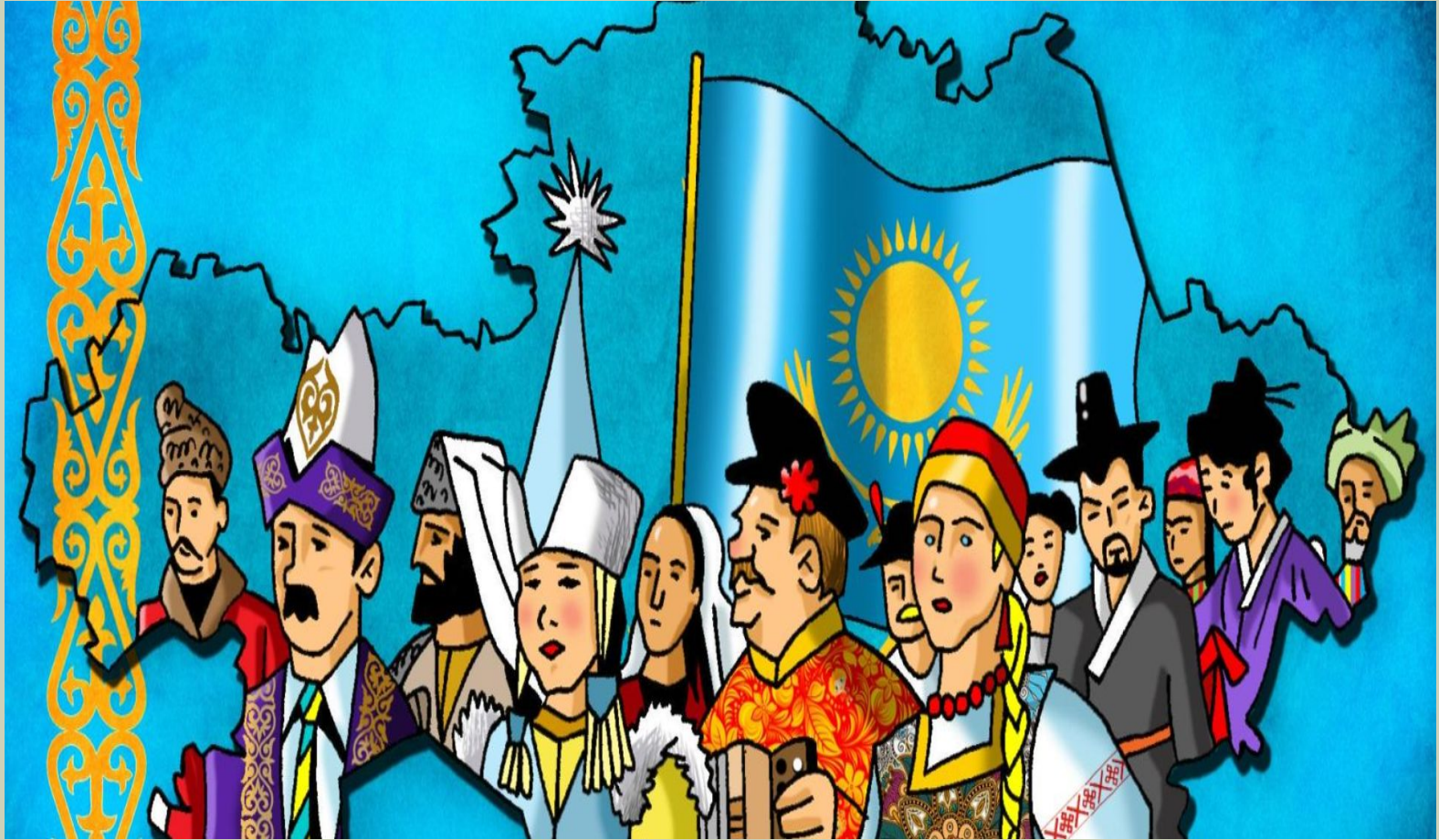
«Қазақстандағы ұлттар достығы иллюстрациясы»