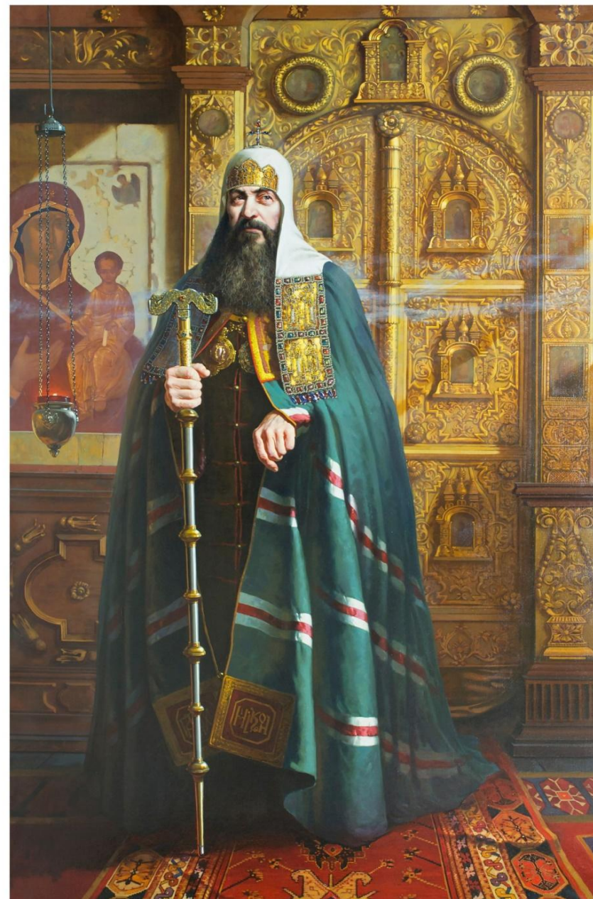
Владимир Середа, «Патриарх Никон», 2015, холст, масло, 230x140