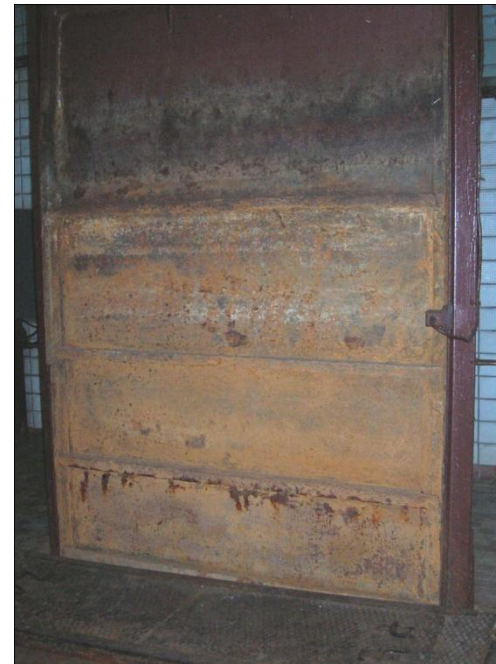
Рис. 8. Пошкодження металевих конструкцій в грабельному відділенні внаслідок враження їх газовою корозією