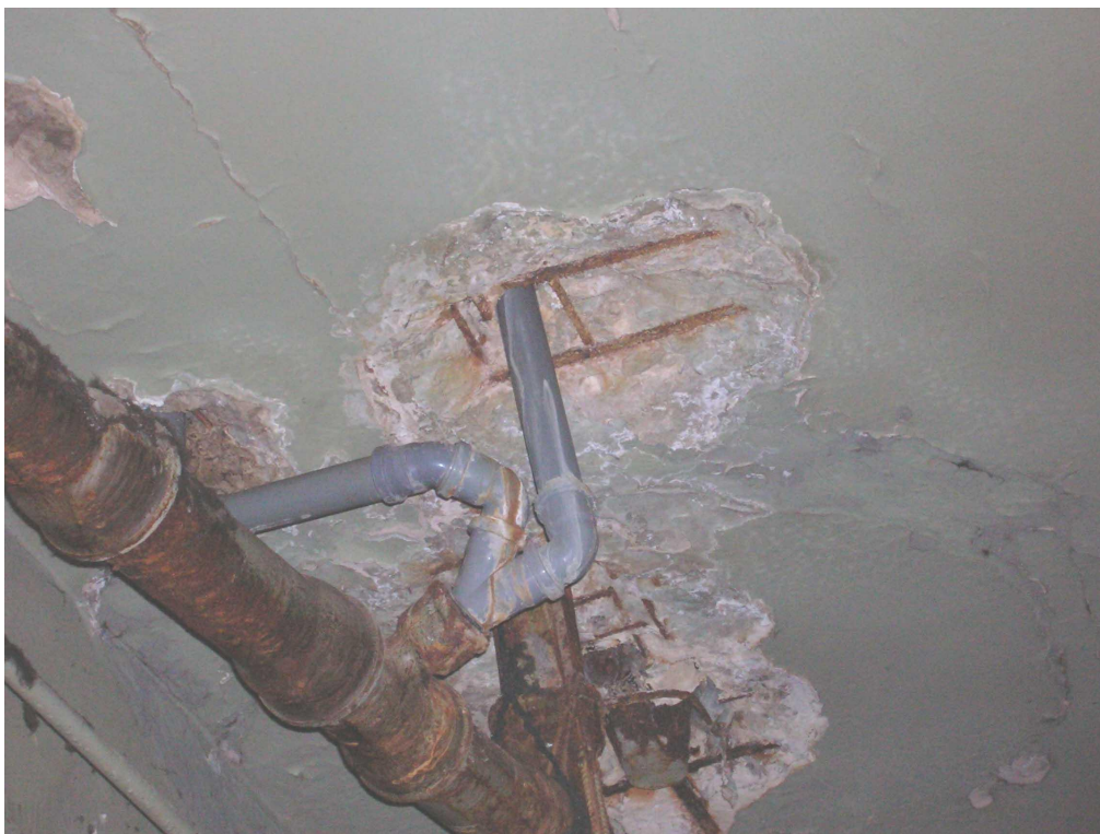
Рис. 5. Пошкодження плити перекриття внаслідок прокладання труб для водовідведення з побутових приміщень