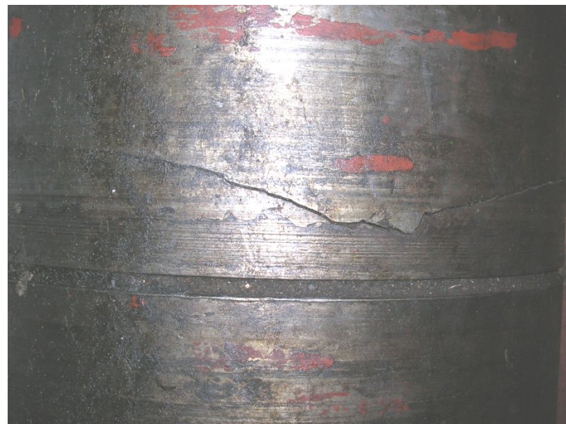
Рис. 7. Пошкодження у вигляді тріщини валу основного насосу № 6