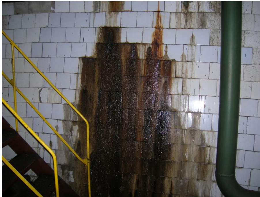
Рис. 4. Фрагмент просочення ґрунтових вод, біля підніжжя циліндричних зовнішніх стін.