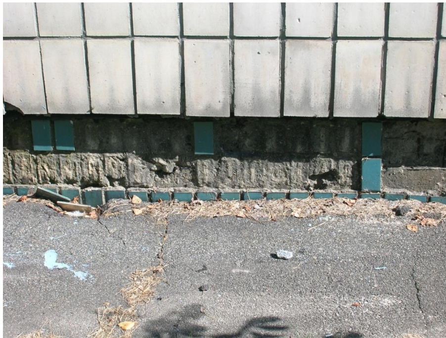
Рис. 3. Фрагмент пошкодження облицювання цоколя споруди та відмостки