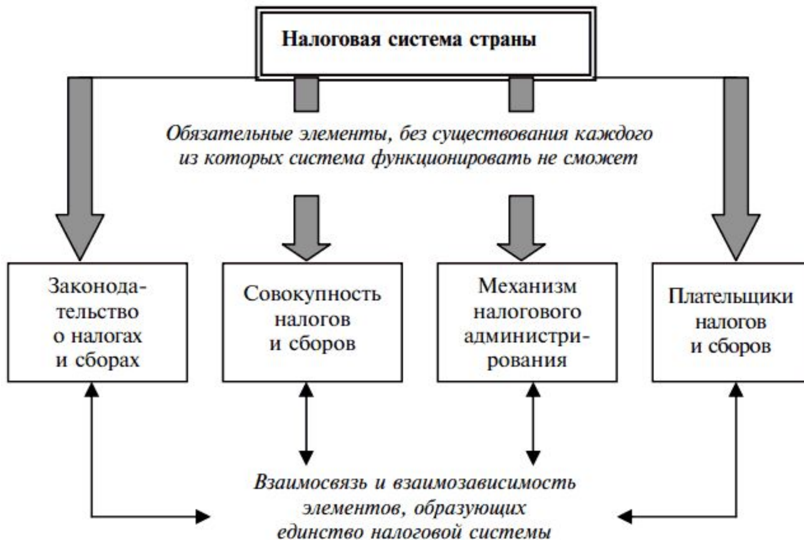
Рис. 2.1. Состав обязательных элементов налоговой системы