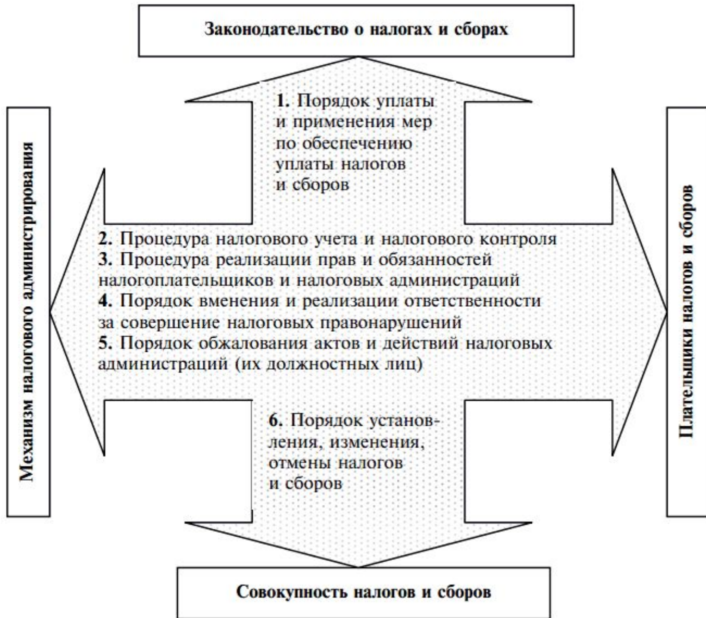
Рис. 2.2. Основные взаимосвязи между элементами налоговой системы