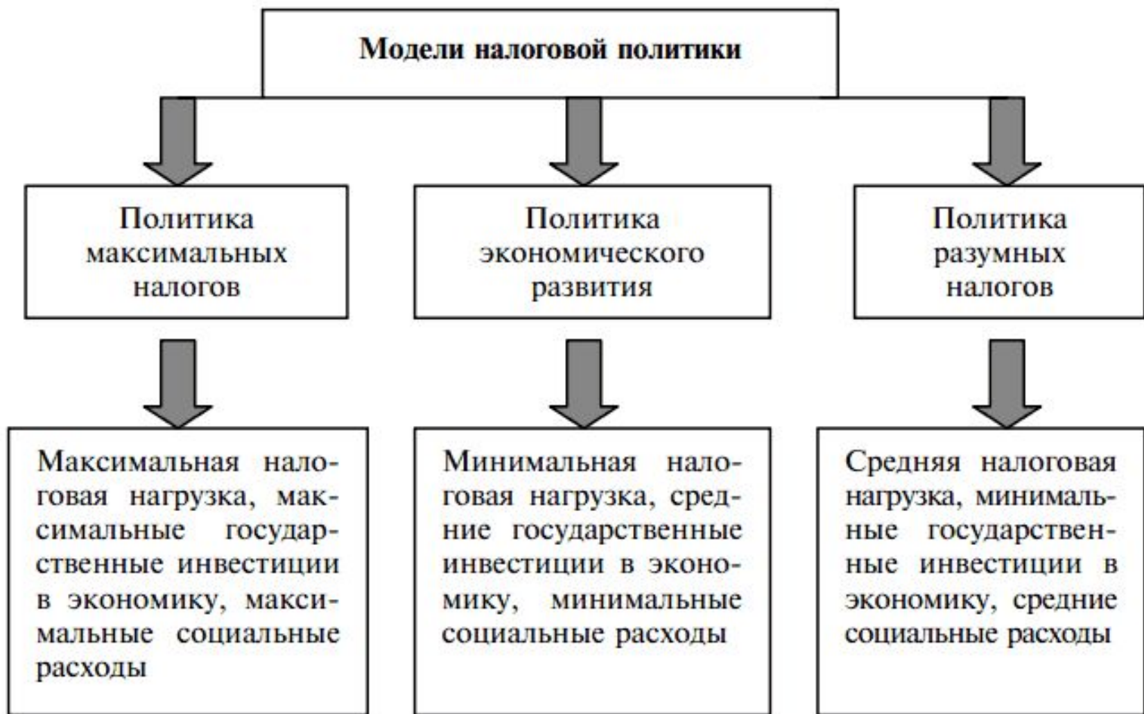
Рис. 2.5. Модели налоговой политики