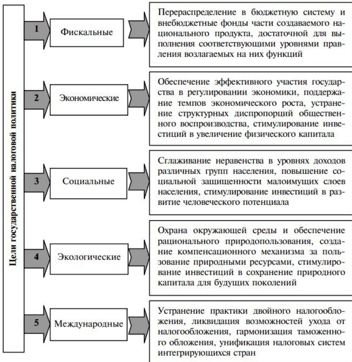
Рис. 2.4. Цели государственной налоговой политики