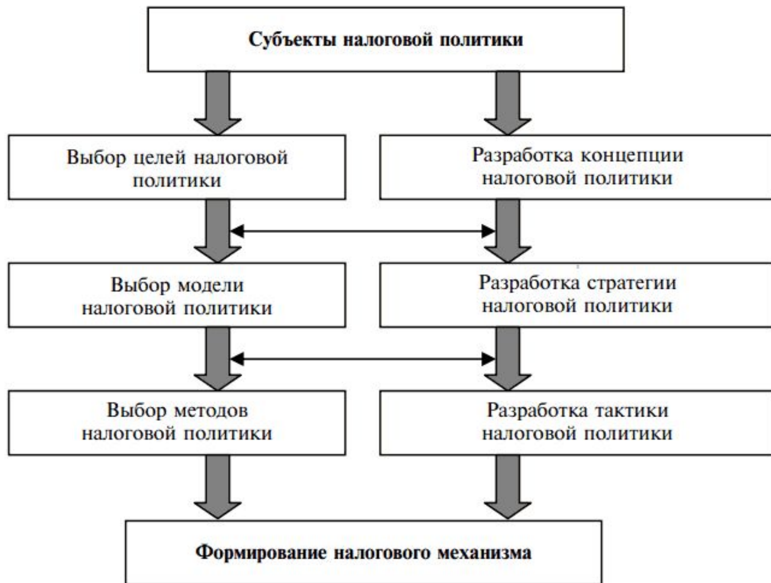
Рис. 2.6. Взаимосвязь налоговой политики и налогового механизма страны