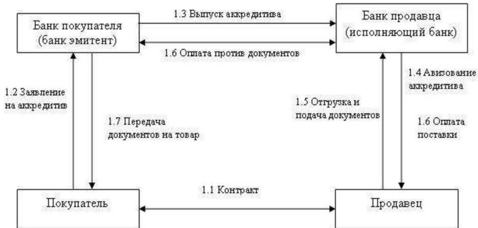
СХЕМА РАСЧЕТОВ ПО АККРЕДИТИВУ