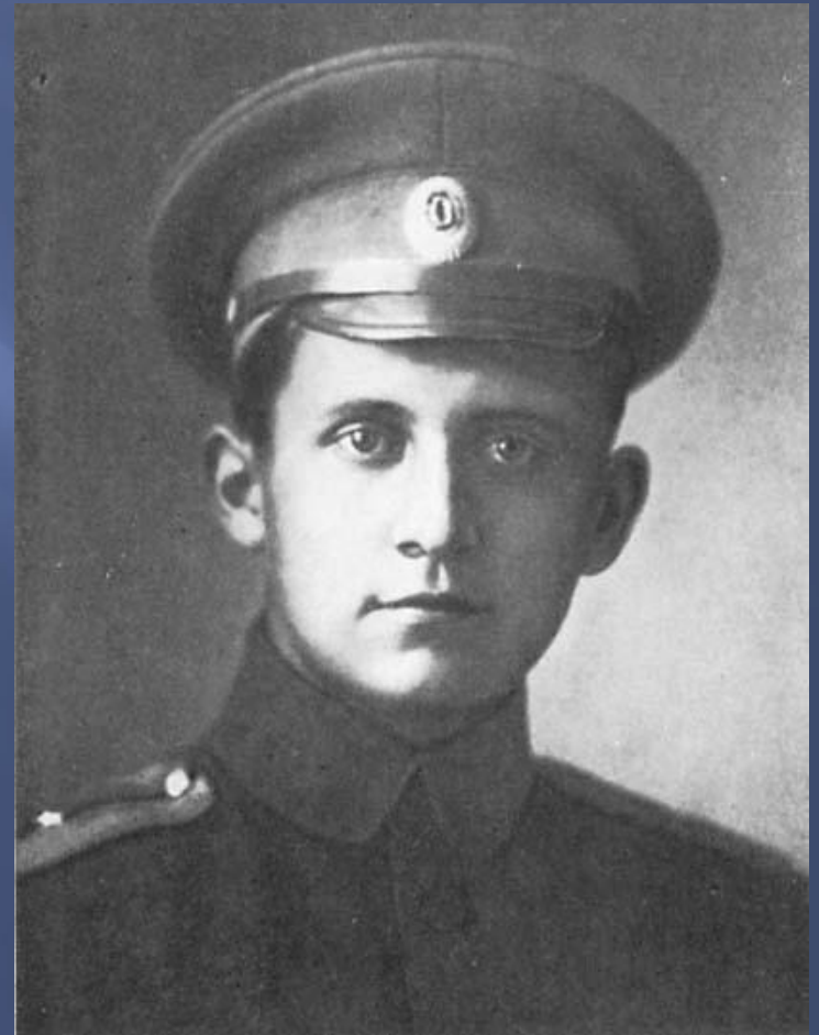
Прапорщик русской армии 1916 г.