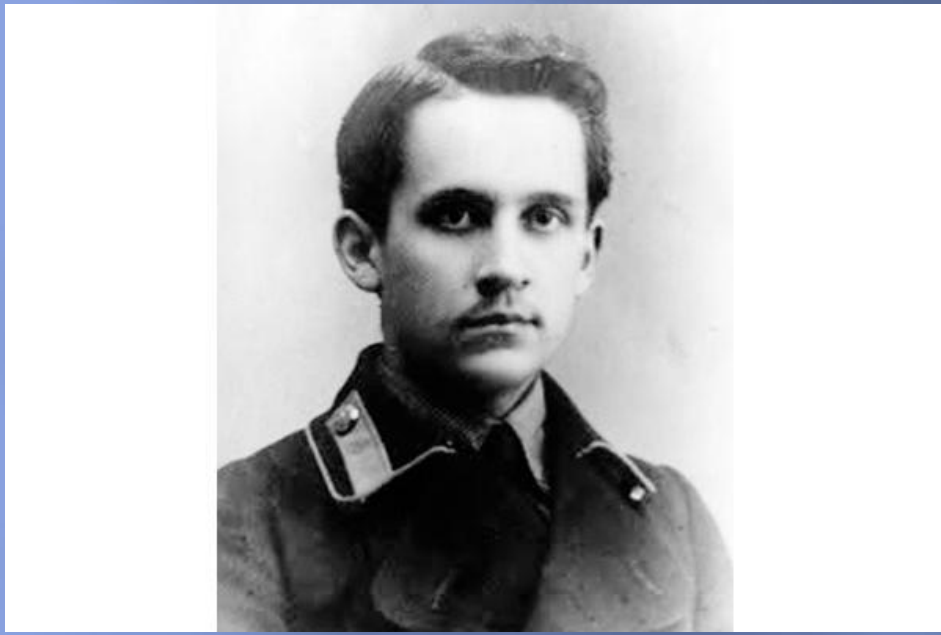
Студент МВТУ г. Москва