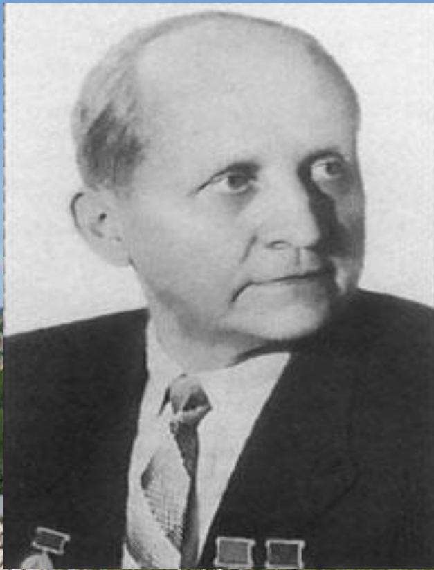
Павел Осипович Сухой