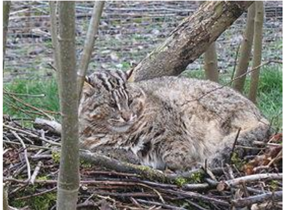
Амурский лесной кот