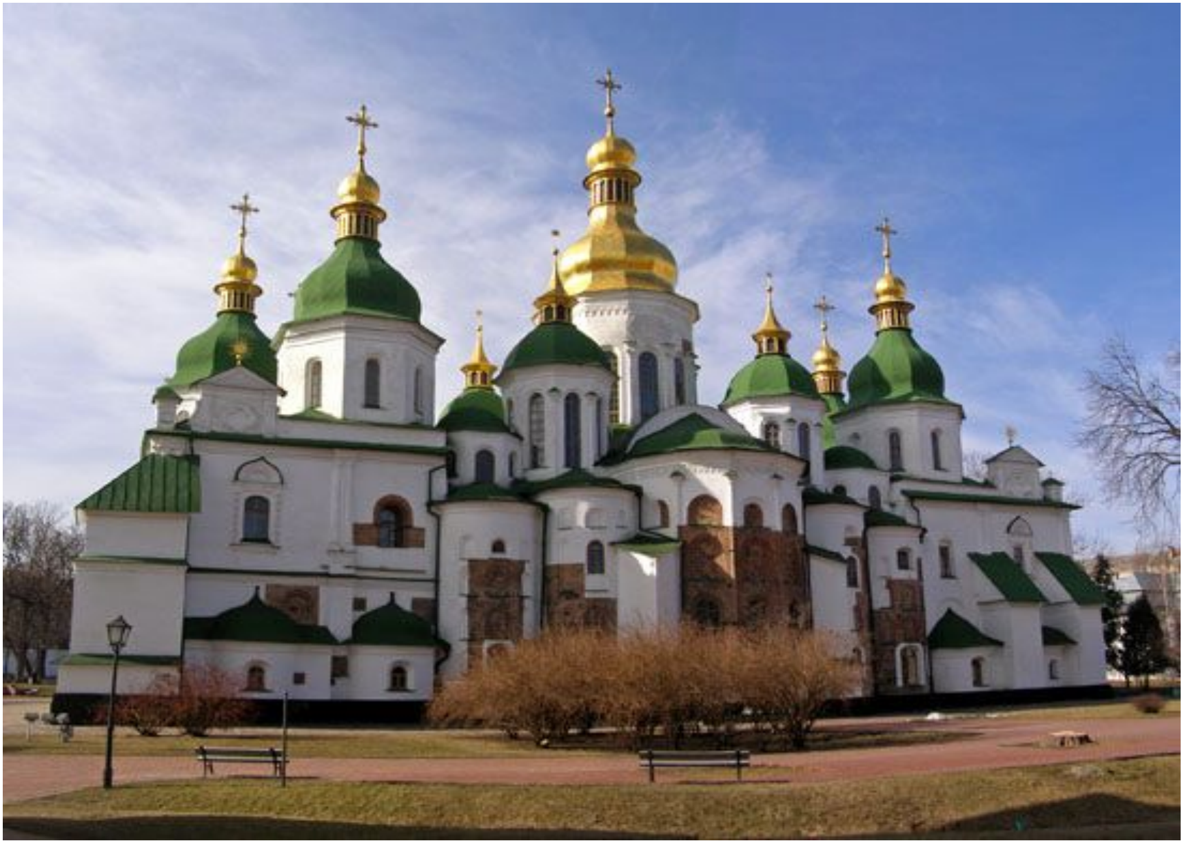
Собор св. Софії