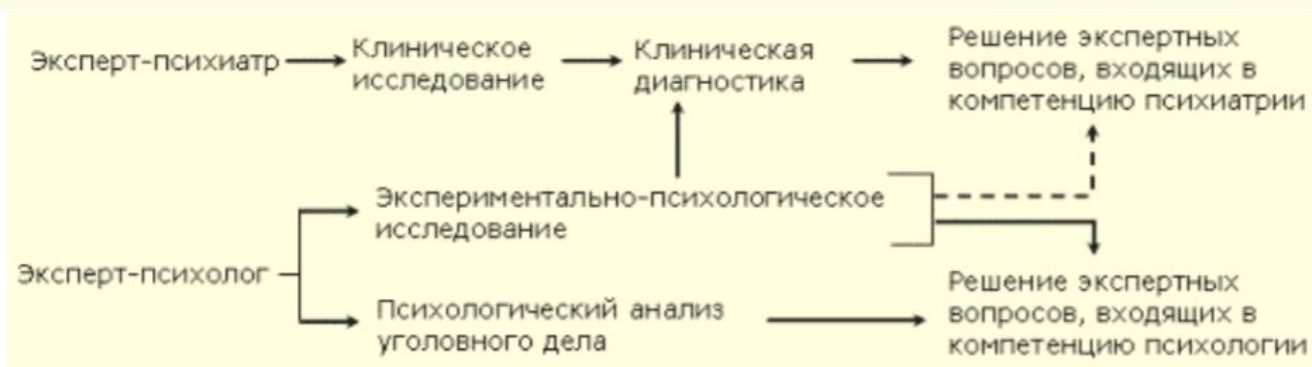
Рис. 3. Взаимодействие эксперта-психолога с экспертом-психиатром при производстве комплексной судебной психолого-психиатрической экспертизы