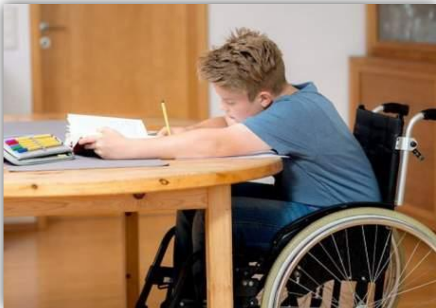
Квоты по приёму в ВУЗы для инвалидов

Дискриминация — предвзятое обращение с другими людьми, основанное на их принадлежности к группе.