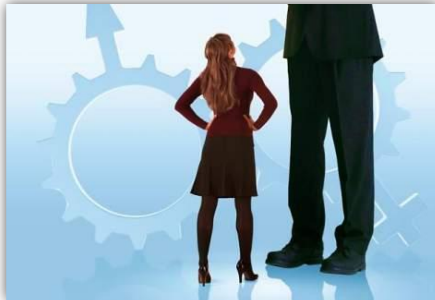
Дискриминация женщин в сфере труда