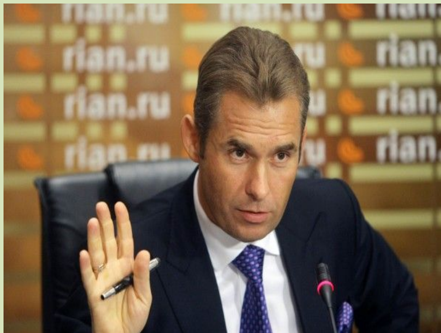
Уполномоченный по правам ребенка в России Павел Астахов