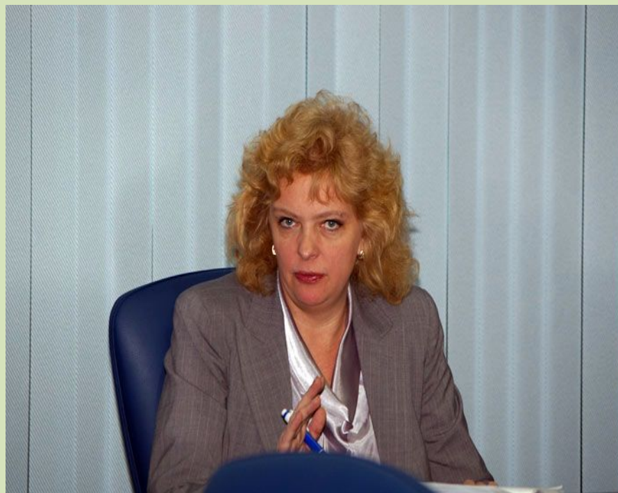
Уполномоченный по правам ребенка в Санкт-Петербурге Светлана Агапитова