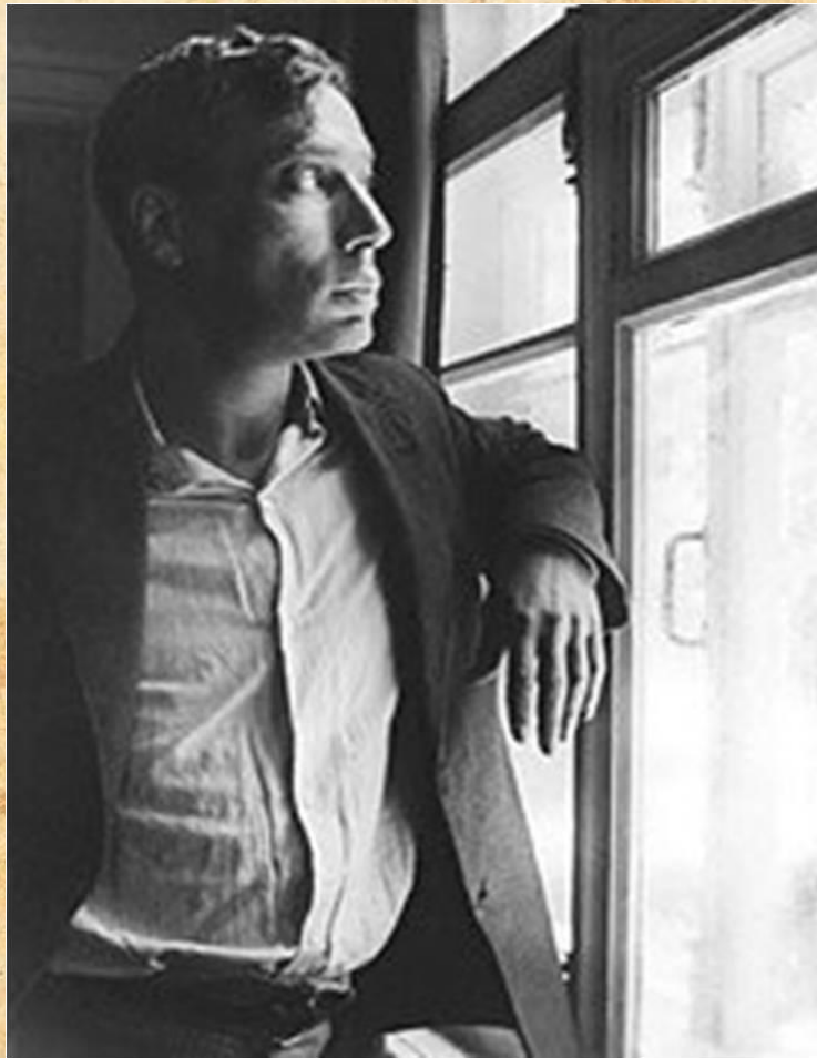
1936 г. Переделкино.

Пастернак начал заниматься литературой в 22 года. Входит в литературную группу лирика. В 1914 году появляется его первая книга «Близнец в тучах», а в 1917-«Поверх барьеров». О нем уже есть критические отзывы