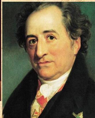
Иоганн Вольфганг фон Гёте