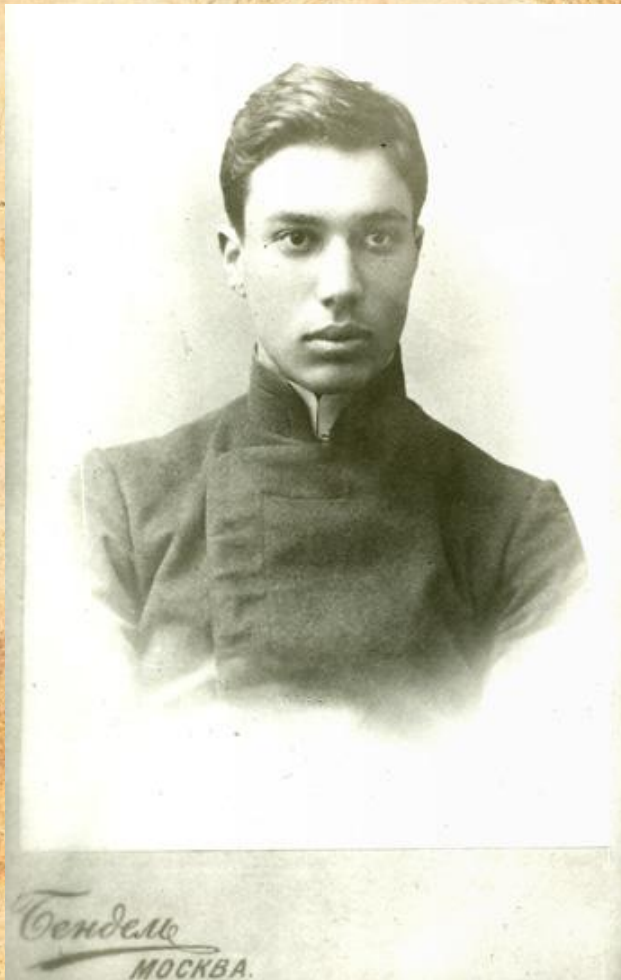
Выпускник Пятой Московской гимназии 1908г.

После окончания московской гимназии в 1909 поступает на историко-филологический факультет Московского университета, серьёзно увлекается философией.