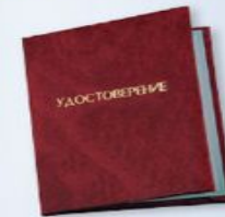
UD4 Размер: 110x80 мм Бумвинил, плотная бумага