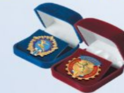
FU125a (бордо) FU125b (синий) Внут. размер: 45x42 мм