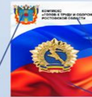
UD7 Размер: 100x70 мм Плотная бумага

На подложке можно использовать Герб Вашего субъекта или города