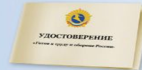
UD6 Размер: 70x100 мм Плотная бумага