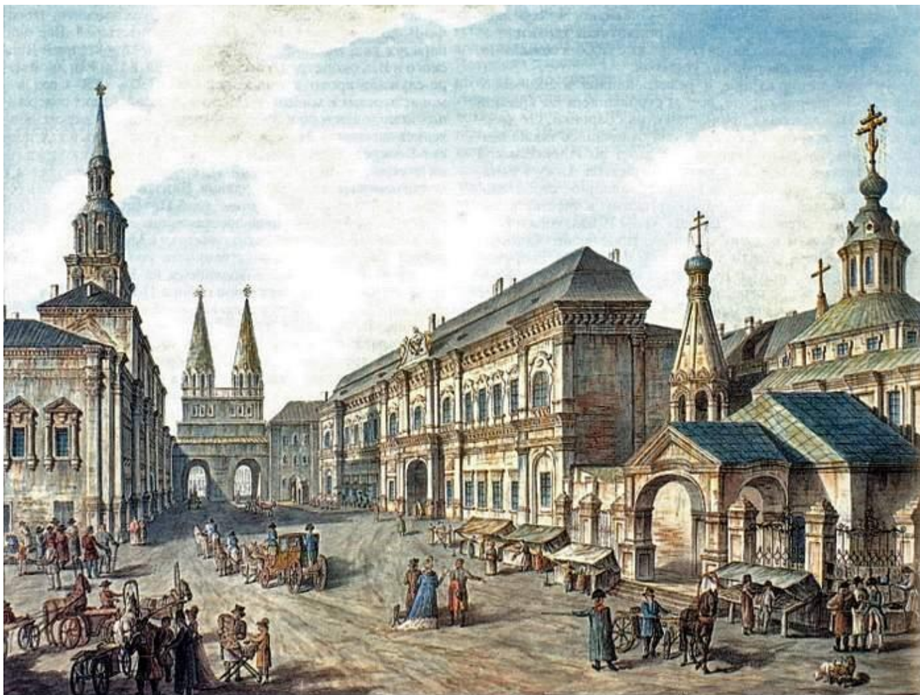
Здание Московского университета (слева) у Воскресенских ворот на Красной площади.