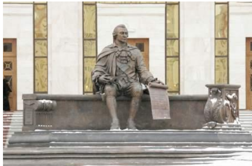
ПАМЯТНИК ОСНОВАТЕЛЮ МОСКОВСКОГО УНИВЕРСИТЕТА И.И. ШУВАЛОВУ К 250-ЛЕТИЮ МГУ. МОСКВА, БРОНЗА, ВЫСОТА – 3,8 МЕТРА. MONUMENT TO I.I. SHUVALOV, FOUNDER OF THE MOSCOW STATE UNIVERSITY, IN HONOR OF THE 250TH ANNIVERSARY OF THE MOSCOW STATE UNIVERSITY. BRONZE, 3.8M HIGH