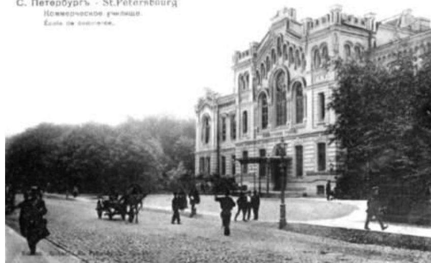
С. Петербургъ - St. Pétersbourg Коммерческое училище. Еще до постройки.