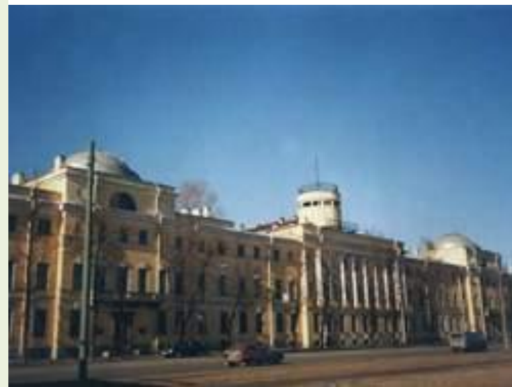
Морской корпус Петра Великого